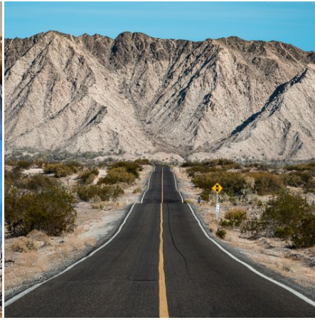
Wo endet diese Straße?,