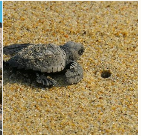
Schildkröten Baja California,