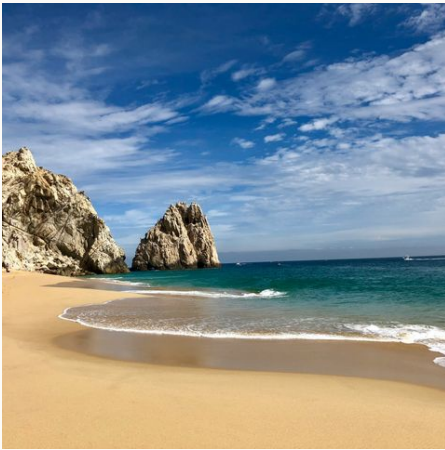
Strand Los Cabos Baja California,

Eingebettet zwischen den endlosen Weiten des Pazifiks und dem geheimnisvollen Meer von Cortez entfaltet die Halbinsel Baja California eine fast mythische Anziehungskraft. Naturfreunde lieben die kontrastreichen Landschaften zwischen Wüste, Gebirge und Küste, wo Kakteen wachsen, Grauwale ihre Jungen gebären und Mangroven in stillen Lagunen flüstern. Aktive Reisende entdecken diese Welt beim Schnorcheln, Wandern oder auf historischen Pfaden. Kulturliebhaber begegnen kolonialem Charme, jahrhundertealten Missionen und Felsmalereien abseits bekannter Routen. In 15 Tagen lernen Sie diese Halbinsel in all ihren Farben und Facetten kennen. Mit dem Mietwagen folgen Sie Ihrem eigenen Rhythmus: halten dort, wo das Licht golden fällt, wo Sie ein Duft lockt oder der Horizont nicht mehr loslässt.