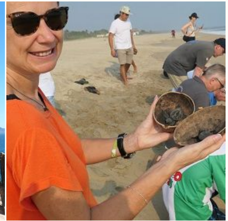
Schildkröten Baja California,