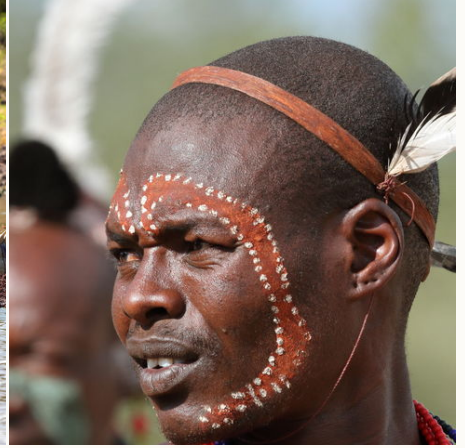
Ein junger Hamar im Omo Tal, Äthiopien