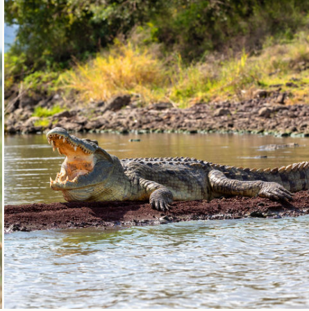
Ein Bad in der Sonne, Äthiopien