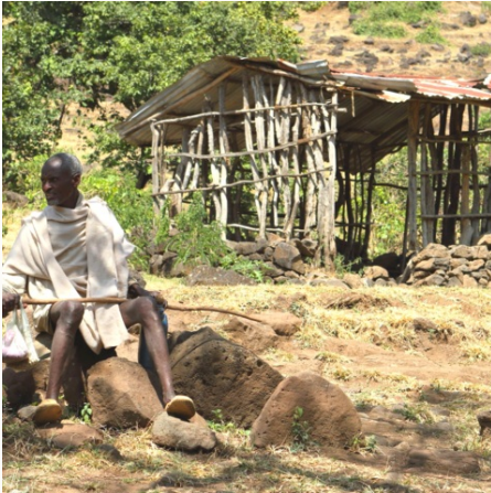
Ein wachsamer Hirte, Äthiopien

Der Süden Äthiopiens beeindruckt durch seine Naturschönheit, die Dank des Großen Grabenbruchs von heißen, trockenen und unfruchtbaren Orten zu einer Kette von schönen Seen reichen. Ihre Route verbindet den Besuch der tierreichen Seen Region mit erlebnisreichen Fahrten zu den verschiedenen Dorfstämmen und deren lebendigen Traditionen.