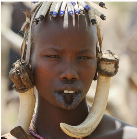
Eine Frau vom Volk der Mursi, Äthiopien

Veranstalter: a&e erlebnis:reisen, eine Marke der Boomerang-Reisen GmbH. Stand: 26.05.2021 (JH)