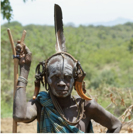
Traditionelle Bemalung der Mursi, Äthiopien