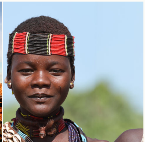
Volk der Hamar aus dem Omo Tal, Äthiopien