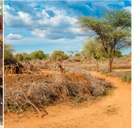
Ländliche Idylle im Hamar-Dorf, Äthiopien