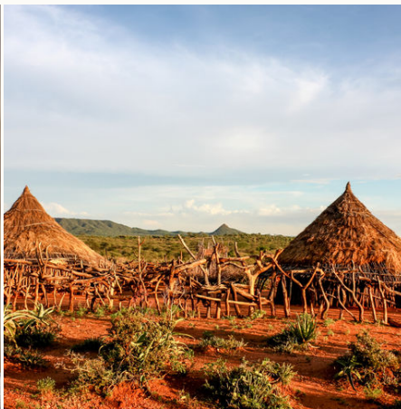
Dorf im Omo Tal, Äthiopien