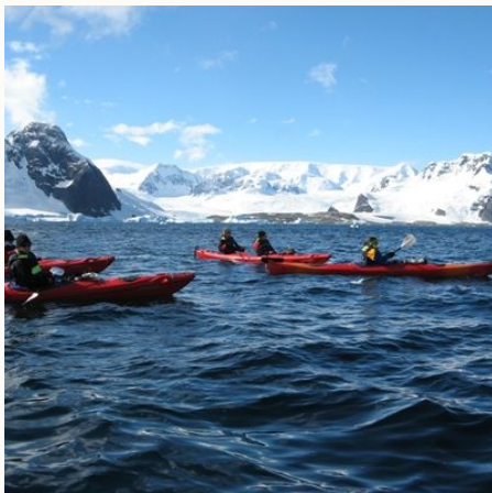
Kayakexkursion in Neko Harbour, Antarktis

Veranstalter: a&e erlebnis:reisen, eine Marke der Boomerang-Reisen GmbH. Stand: 20.08.2025 (HC)