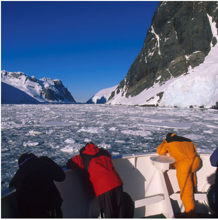
Abenteuer pur!: Schiff fährt durch den Lemaire Kanal, Antarktis