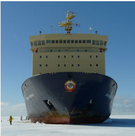
Schiff im Eis, Antarktis

Das Schiff wird an ausgewählten Terminen zu unserem Basislager für aktive Gäste aufbrechen. „Basislager“ ist per Definition ein Lagerort und Ausgangspunkt, von dem aus eine Aktivität beginnt, in diesem Fall sind es Tagesexkursionen „von Küste zu Berg“. Auf den Basecamp-Reisen wird das Schiff zu sorgfältig ausgesuchten Orten der Antarktis gesteuert. In diesen Gebieten wird das Schiff zwei bis drei Tage verweilen und dient dort als komfortables Basislager und Drehkreuz für unser Aktivprogramm, bei dem wir mehr Zeit für ein breites Spektrum von Aktivitäten einräumen: Bergsteiger und Wanderer erkunden Gipfel und Aussichtspunkte, Fotografen erkunden Fotomöglichkeiten, Field Camper verbringen die Nacht im Zelt in Anlandungsnähe, Kajakfahrer und Fahrgäste von Zodiacs (Schlauchbooten) entdecken die Küstenlinie und Buchten, in die das Schiff nicht vordringen kann. Gäste, die nicht körperlich aktiv werden wollen, können an unserem normalen Landausflugsprogramm teilnehmen (leichte bis mittelschwere Spaziergänge bis Wanderungen mit Fokus auf die Tierwelt). Wir bieten unter anderem auch die Möglichkeit an, sich einem Foto-Workshop anzuschließen. Alle Abenteueraktivitäten sind im Preis enthalten.