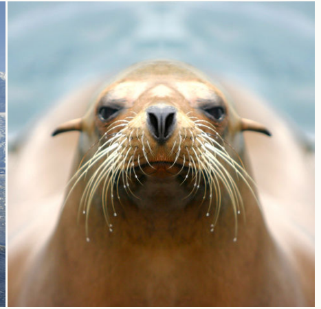
Hallo du feiner Kerl!: Seehund Nahaufnahme, Antarktis