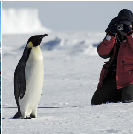
Fotograf im Eis, Antarktis