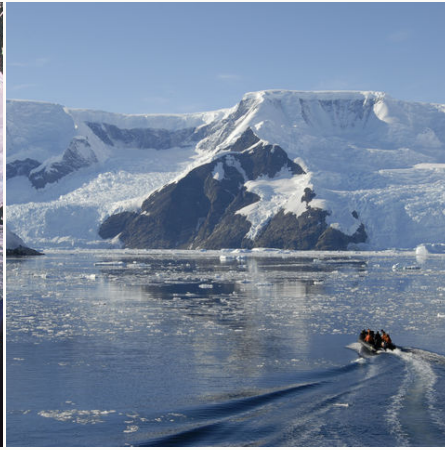
Neko Harbour auf der antarktischen Halbinsel, Antarktis