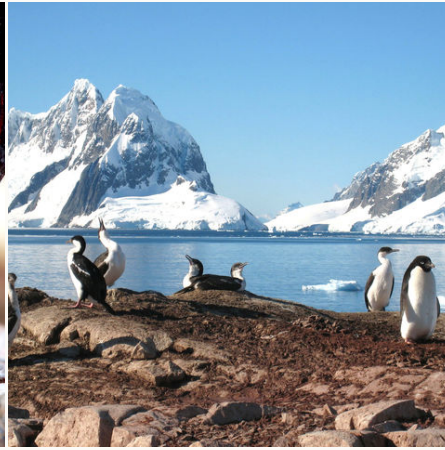
Adeliepinguin und andere Seevögel auf der Petermann Insel, Antarktis