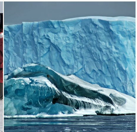
Türkisblaue Eisberge, Antarktis