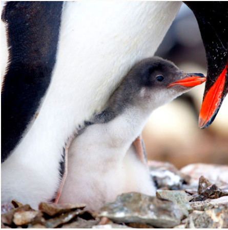
Pinguinküken mit Elternteil, Antarktis