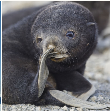
Junge Seerobbe, Antarktis