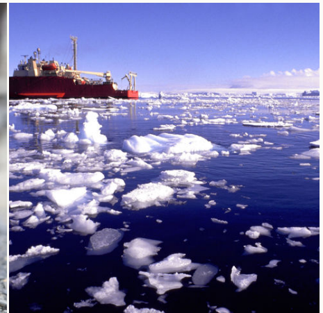
Eisbrecher zwischen Eisschollen, Antarktis