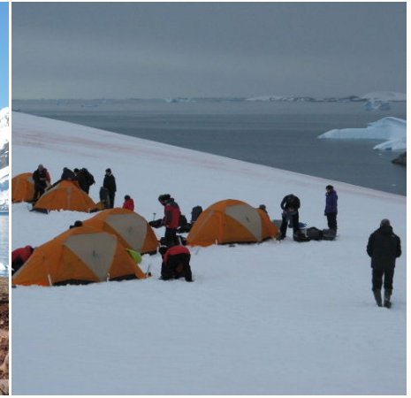
Aufbau des Zeltlagers im Schnee, Antarktis