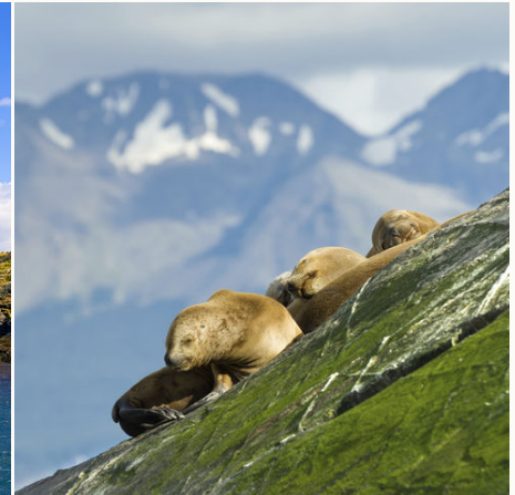
Seelöwen am Beagle-Kanal bei Ushuaia, Argentinien