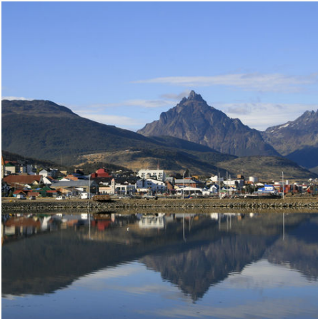
Ushuaia, die südlichste Stadt Argentiniens, Argentinien