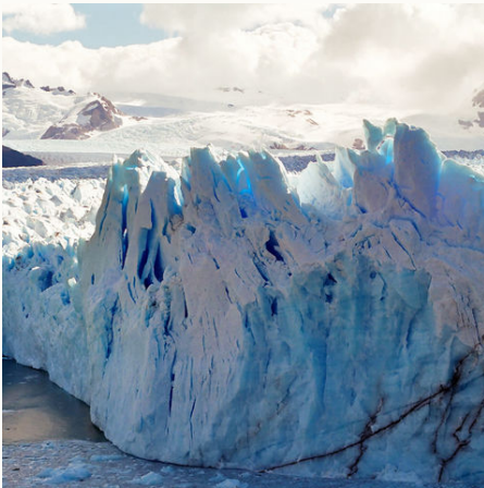
Eismassen des Perito-Moreno-Gletschers, Argentinien

Auf dieser spannenden Mietwagenreise erleben Sie die unentdeckten Schönheiten von Patagonien und Feuerland – von El Chaltén bis Ushuaia, der südlichsten Stadt der Welt. Lassen Sie sich von der beeindruckenden Flora und Fauna der Region beeindrucken und erleben Sie diese bei Wanderungen am Fuße des Cerro Fitz Roy oder im Los Glaciares Nationalpark hautnah. Eine raue, vom Wind geformte Landschaft, kristallblaue Gletscherseen, gigantische Granitberge und riesige Tierkolonien prägen diese Region. Über den Garibaldi-Pass erreichen Sie die im Feuerland gelegene „Bucht in das Land des Westens“, wie die Ureinwohner Argentiniens die südlichste Stadt der Welt liebevoll nennen. Dort erwarten Sie schroffe Berggipfel, uralte Südbuchenwälder und einsame Moore. Bei einer Küstenwanderung können Sie die traumhafte Aussicht genießen und Ihre Seele baumeln lassen. Wer Abgeschlossenheit und unberührte Natur sucht, wird diese Reise an die Südspitze Lateinamerikas lieben.