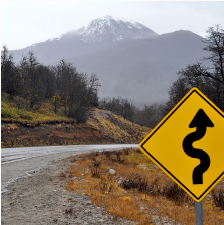
National Route 234 in San Martin de los Andes, Argentinien