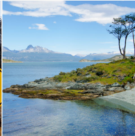
Küste nahe Ushuaia, Argentinien