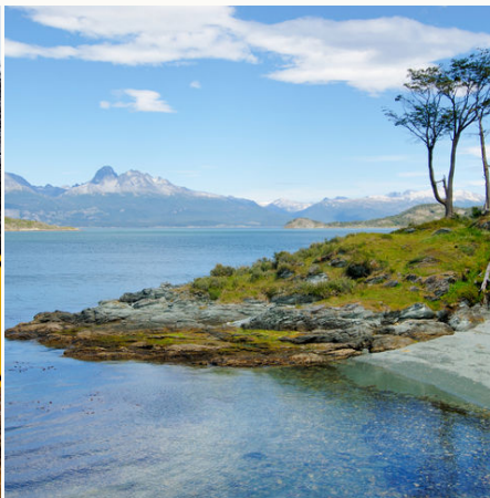
Küste nahe Ushuaia, Argentinien