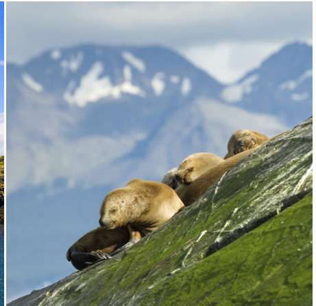
Seelöwen am Beagle-Kanal bei Ushuaia, Argentinien