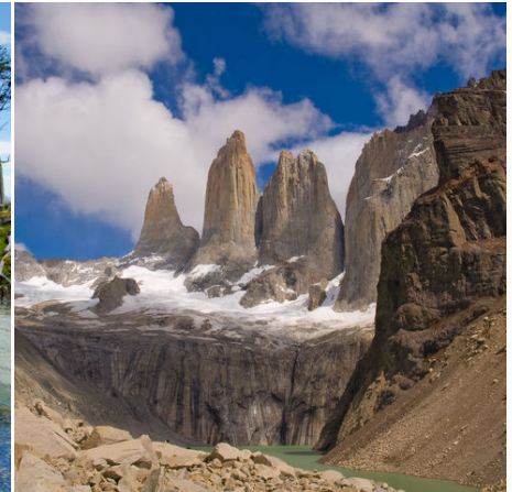
Torres-Spitzen im Torres del Paine Nationalpark, Chile