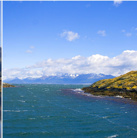
Leuchtturm am Ende der Welt, Argentinien