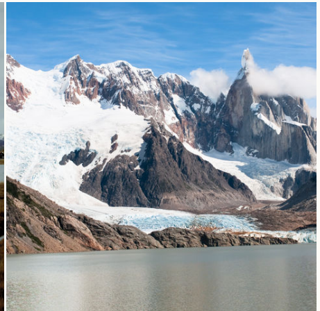
Cerro Torre im Los Glaciares Nationalpark, Argentinien