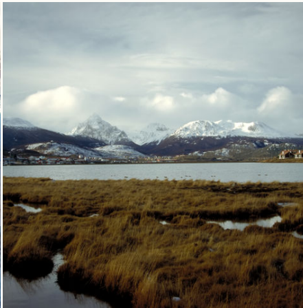
Schneebedeckte Berge in Ushuaia, Argentinien