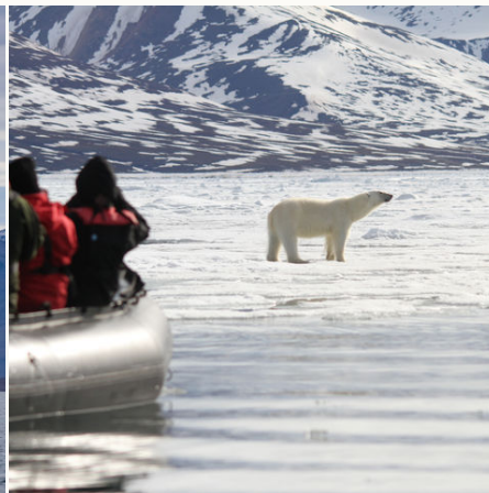
Eisbärbeobachtung in Spitzbergen, Arktis