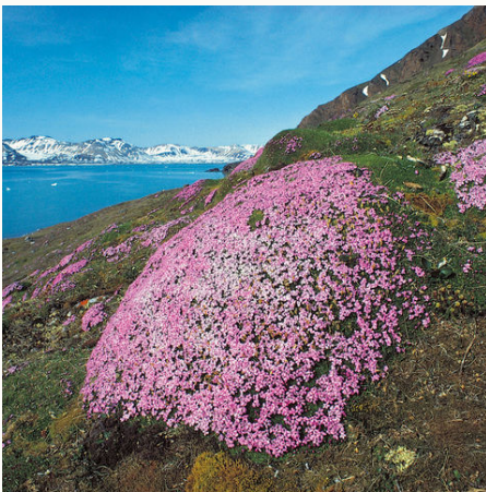
Blühende Wildnis Spitzbergens, Arktis

Tauchen Sie ein in die eisigen Gewässer des Nordatlantiks auf einer außergewöhnlichen Expeditionsfahrt rund um Spitzbergen. Der norwegische Archipel empfängt Sie mit wilder Schönheit und einer einzigartigen Tierwelt. In den Sommermonaten scheint die Sonne hier rund um die Uhr, während im Winter die lange Polarnacht die Landschaft in Dunkelheit hüllt. Umgeben von den kalten Gewässern des Nordatlantiks, bietet Spitzbergen eine unvergessliche Szenerie aus gigantischen Gletschern, schroffen Bergen und unberührten Gewässern. Auf dieser Kreuzfahrt entdecken Sie die majestätische Wildnis der Arktis und beobachten Eisbären, Walrosse, Rentiere, Polarfüchse und eine Vielzahl von Vogelarten in ihrem natürlichen Lebensraum. Ihre Reise beginnt in Longyearbyen, der größten Siedlung der Region, und führt Sie zu den beeindruckenden Gletscherfronten des Krossfjords und des Monaco-Gletschers. Besuchen Sie Ny Ålesund, die nördlichste Siedlung der Welt und ein bedeutendes Forschungszentrum, und erleben Sie die faszinierende Geschichte und die moderne Wissenschaft dieser einzigartigen Region. Jede Expedition bietet einzigartige Erlebnisse, da sich die Klima- und Eisbedingungen ständig ändern. Wanderungen und Zodiac-Anlandungen ermöglichen Ihnen tiefe Einblicke in die unberührte Natur der Arktis. Eine unvergessliche Reise in die Welt des eisigen Nordens.