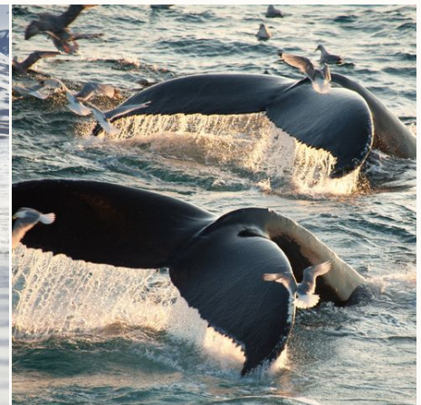
Buckelwale im Nordatlantik, Arktis