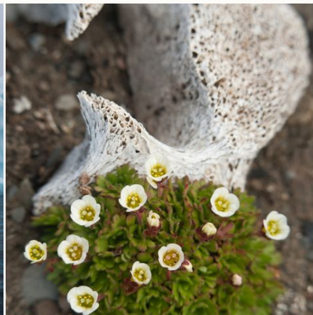
Weißer Mohn blüht aus Walknochen, Arktis