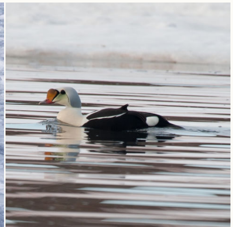
Prachteiderente bei Spitzbergen, Arktis