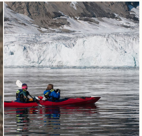
Kayaking in Spitzbergen, Arktis