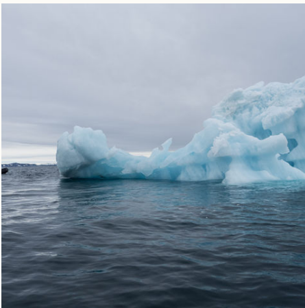
Mit dem Schlauchboot zum Eisberg, Arktis

✓ Verfügbar ⚠ Wenige Plätze ➖ Ausgebucht 🛡 garantierte Durchführung