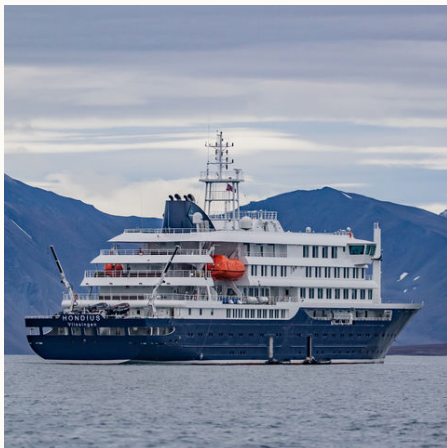
Hondius in Spitzbergen, Arktis

Veranstalter: a&e erlebnis:reisen, eine Marke der Boomerang-Reisen GmbH. Stand: 27.05.24 (LI/SP)