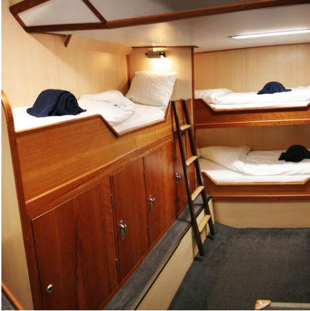
3-Bett-Kabine mit Bullauge auf der Rembrandt van Rijn, Norwegen