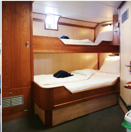
Die private Doppelkabine mit Bullauge auf der Rembrandt van Rijn, Norwegen