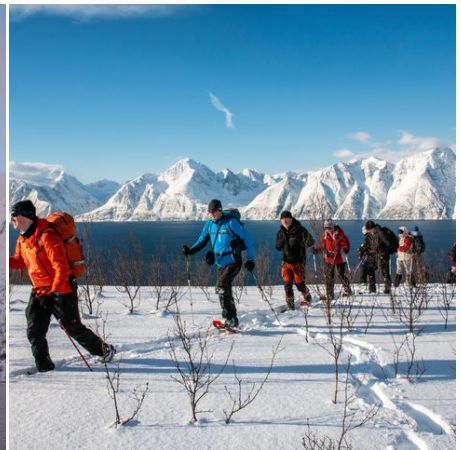
Ausflug auf dem Festland (Option B), Norwegen