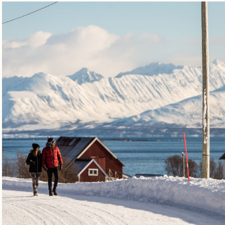
Entspannter Spaziergang (Option B), Norwegen