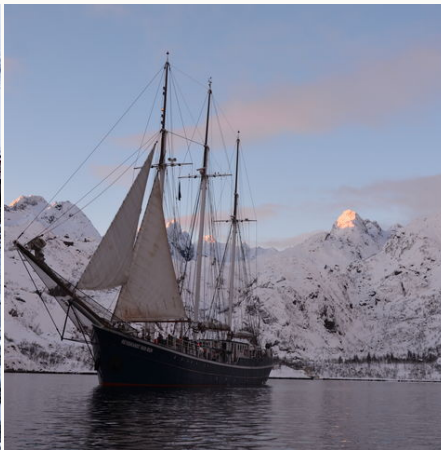
Die Rembrandt van Rijn im Norden Norwegens, Norwegen