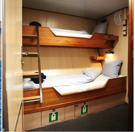
Private Doppelkabine innen der Rembrandt van Rijn, Norwegen