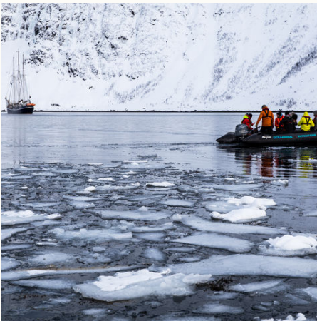
Unterwegs mit dem Zodiac, Norwegen

Die Arktis ist ein Land der Extreme: glitzernde Eislandschaften, dramatische Fjorde und stille, endlose Weiten wechseln sich ab mit dem Spiel von Licht und Schatten auf Schnee und Wasser. Hier treffen wir auf neugierige Polarfüchse, majestätische Wale und die Könige der Kälte, die Eisbären, während nachts die Polarlichter wie tanzende Schleier über den Himmel ziehen. Die „Rembrandt van Rijn“ ist das ideale Schiff, um diese Welt zu erkunden. Mit ihrem historischen Charme und modernem Komfort gleitet sie durch die Gewässer zwischen Island, Grönland, Spitzbergen und Norwegen. Auf Deck spürt man den Wind, hört das Meer und erlebt die Arktis in ihrer ganzen Intensität.