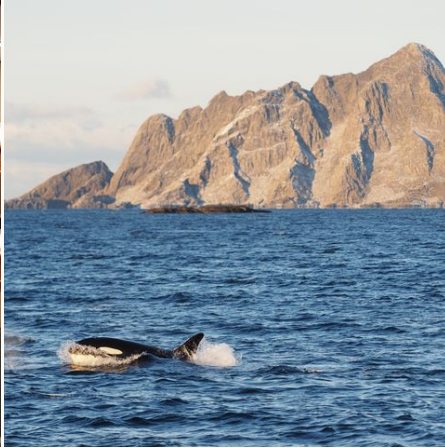
Orca im Norden Norwegens (Option A), Norwegen