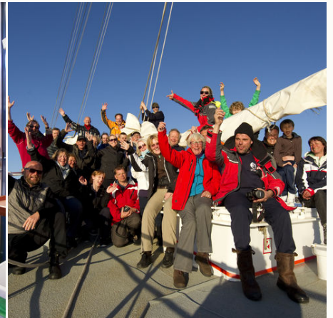
Gruppenfoto auf der Rembrandt van Rijn, Norwegen