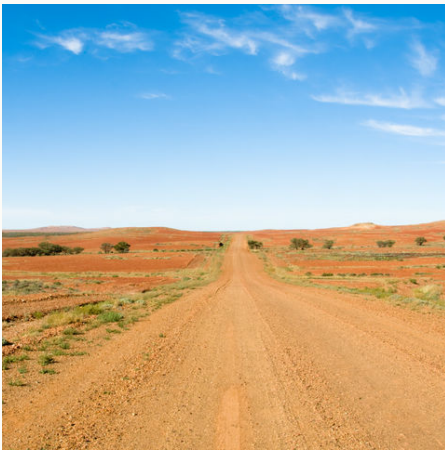
Weitläufige Straße im Outback, Australien

Auf dieser Reise erleben Sie, was Australien zu bieten hat. Zunächst folgen Sie dem Trubel in der schillernden Hafenmetropole Sydney. Im Roten Zentrum erwartet Sie die mystische Traumzeit. Hohe Felsen, tiefe Schluchten und kleine Oasen sehen Sie auf Ihrer Offroad-Abenteuer-Tour im Outback zwischen Ayers Rock und Alice Springs. Zeit sich den Staub vom Körper zu waschen finden Sie dann im tropischen Norden des Landes. In Palm Cove können Sie das entspannte Flair unter Palmen genießen. Lassen Sie den weißen Sand Ihre Füße massieren und schnorcheln Sie im Ozean mit den bunten Fischen des Great Barrier Reef. Tauchen Sie ein in die Faszination Australiens.