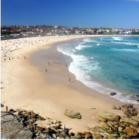
Bondi Beach in Sydney, Australien

Bitte beachten Sie, dass es bei Reisen z.B. über Weihnachten / Silvester zu Hochsaison-Aufpreisen kommen kann. Gerne machen wir Ihnen auf Anfrage ein konkretes Angebot für diesen Zeitraum.