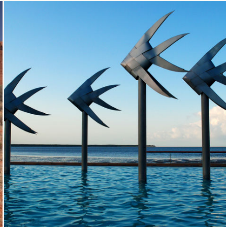
Die Lagune in Cairns, Australien