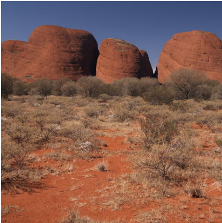
Die Olgas (Kata Tjuta) im Outback, Australien