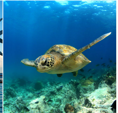
Schildkröte im Great Barrier Reef, Australien