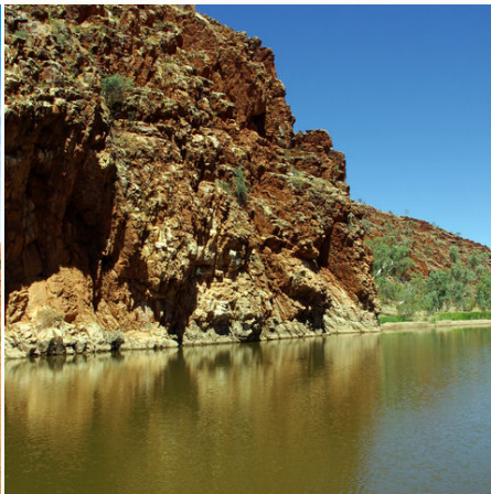
Glen Helen Gorge, Australien