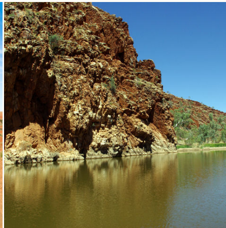
Glen Helen Gorge, Australien