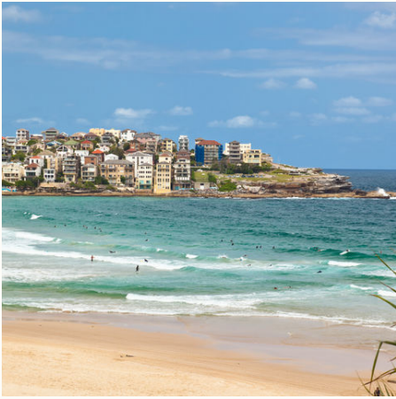
Bondi Beach Sydney, Australien