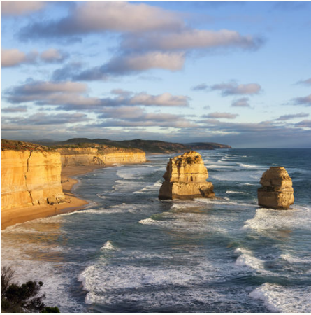
Twelve Apostles, Australien