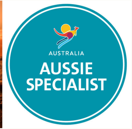
Logo Aussie Specialist, Australien