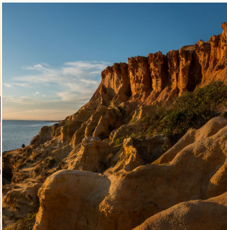
Sonnenuntergang am schwarzen Felsstrand (Black Rock Beach) nahe Melbourne, Australien