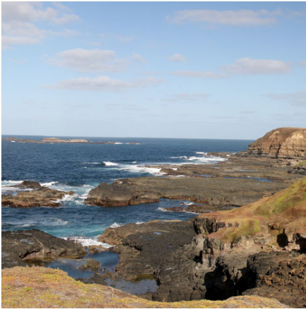
Küste auf Phillip Island, Australien

Ihr Abenteuer startet im kosmopolitischen Melbourne, doch die Verheißung auf die vielen Natur-Erlebnisse lockt Sie schnell aus der Stadt. Sie streifen auf dieser Australien Mietwagenrundreise durch viele unterschiedliche Landschaften, die Sie bei Spaziergängen und Wanderungen erkunden können. Vom Sandsteingebirge im Grampians Nationalpark über die raue Küste an der Great Ocean Road bis zu den sanften Badestränden am "weißesten Strand" Australiens. Gekrönt wird Ihre Reise mit Übernachtungen in gehobenen, wundervoll in die Landschaft eingebetteten Unterkünften, die keine Wünsche offen lassen.