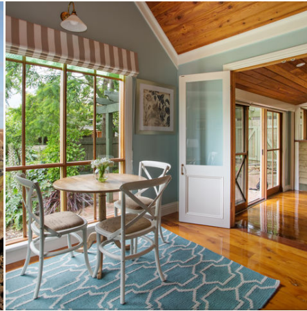
Oak Tree Lodge B&B, Australien