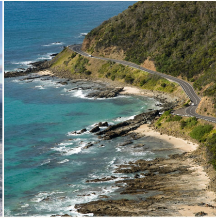
Great Ocean Road, Australien