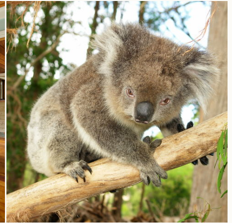
Koala an einem Baumstamm, Australien