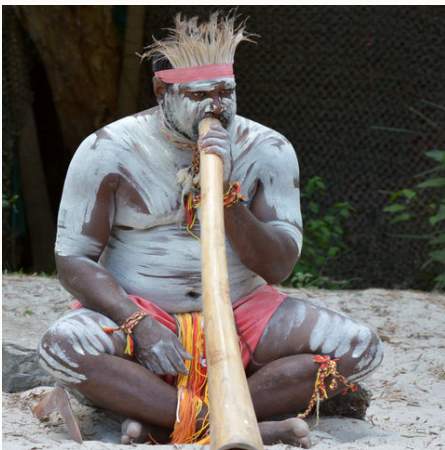
Didgeridoo spielender Aborigini, Australien