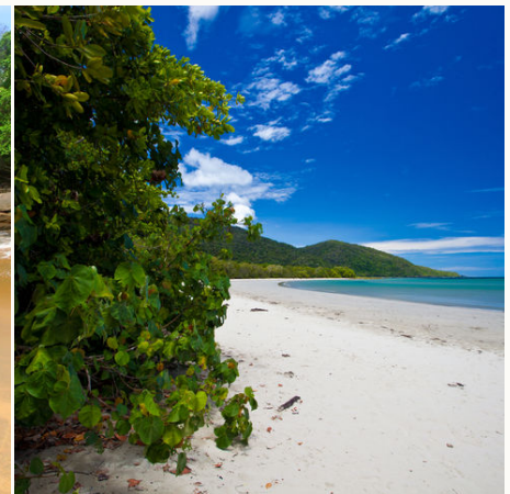
Regenwald trifft auf Ozean, Cape Tribulation, Australien