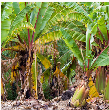
Bananenplantage im Norden von Queensland, Australien