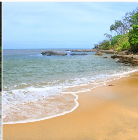
Trinity Beach bei Cairns, Australien