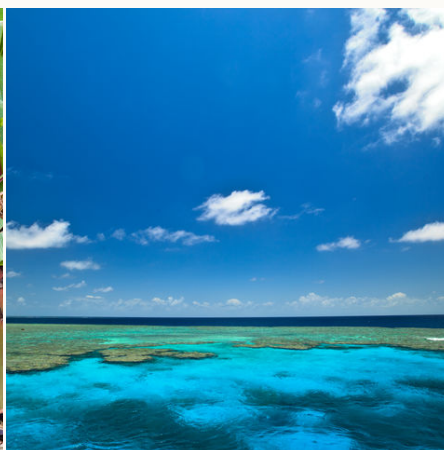
Great Barrier Reef, Australien