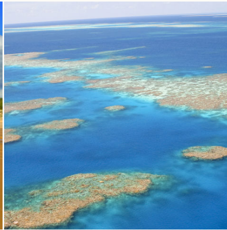
Great Barrier Reef an der Ostküste, Australien