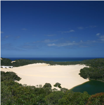
Lake Wabby auf Fraser Island, Australien