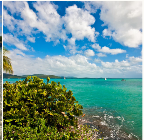
Airlie Beach, Australien