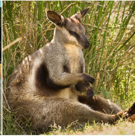
Wallaby im Schatten, Australien