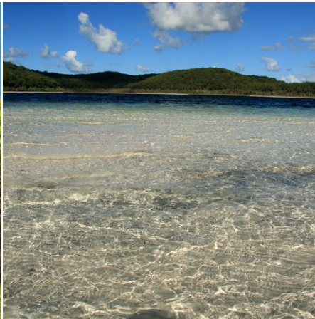
Lake McKenzie, Australien