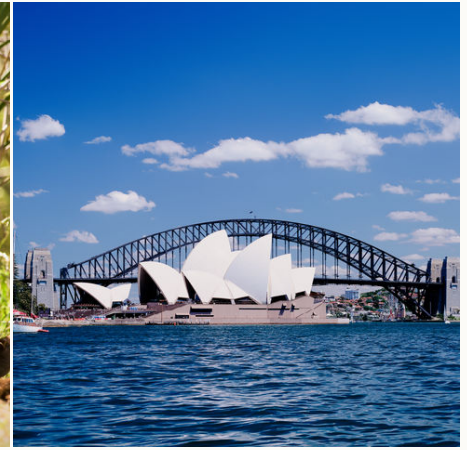
Die berühmtesten Sehenswürdigkeiten Sydney, Australien