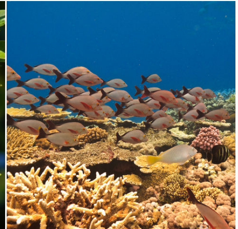
Fischschwarm im Great Barrier Reef, Australien