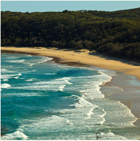
Strand in Queensland, Australien