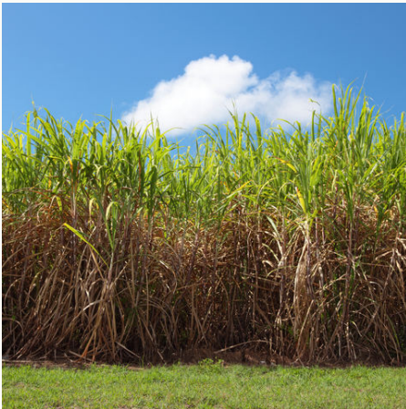
Zuckerrohrplantage im Norden von Queensland, Australien

Bei dieser Reise nach Australien entdecken Sie die sonnige Ostküste. Ab Sydney wartet ein Abenteuer auf Sie, welches Sie entlang der Gold Coast und der Sunshine Coast in immer tropischere Gefilde bringt. Lassen Sie sich einhüllen vom blauen Dunst der Blue Mountains und verwöhnen Sie Ihren Gaumen mit leckerem Wein und Schokolade im Hunter Valley. Vorbei an Zuckerrohrfeldern und Bananenplantagen lohnen Abstecher in die wundervollen Nationalparks. Begeben Sie sich auf die Suche nach dem Platypus und entdecken Sie unter Wasser das magische Great Barrier Reef. Zwei weitere Highlights dürfen auf der Tour entlang der vielseitigen Küste ebenfalls nicht fehlen: die Sandinsel Fraser Island und die paradiesisch anmutenden Whitsunday Islands. Weiße Sandstrände laden immer wieder zum Verweilen ein und geben Zeit die imposanten Eindrücke wirken zu lassen. Steigen Sie ein und fahren Sie los!