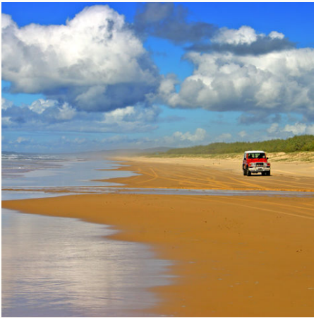
Autostrand auf Fraser Island, Australien