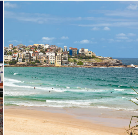
Bondi Beach Sydney, Australien