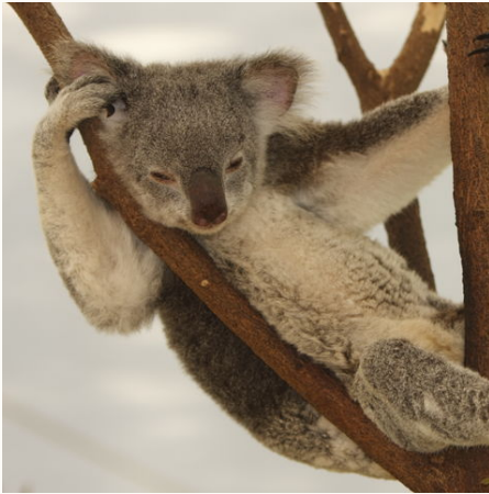
Faulenzender Koala im Eukalyptus Baum, Australien

Spannende Metropolen und faszinierende Naturhighlights säumen den Weg auf dieser Reise. Die raue Küste entlang der Great Ocean Road macht immer wieder Platz für wilde Strände und gemütliche Küstenorte. Tierisch wird es auf Phillip Island und Kangaroo Island – Pinguine, Kängurus, Koalas und Seelöwen heißen Sie willkommen. Nach vielfältigen Eindrücken von der wilden Schönheit und vier der größten Städte des Landes, haben Sie sich einen guten Tropfen verdient und kaum ein Ort bietet sich hierfür besser an, als das Barossa Valley mit seinen zahlreichen Weinkellern. Auf eine gelungene Reise!