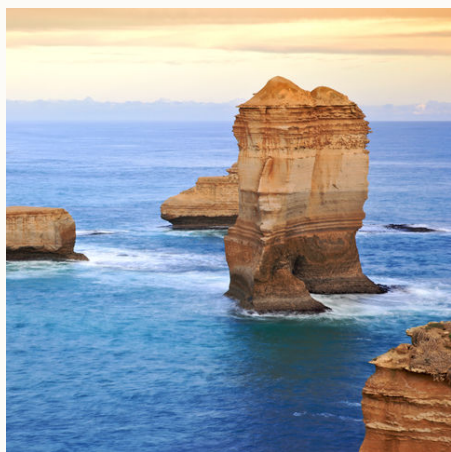
12 Apostel Great Ocean Road, Australien

Bitte beachten Sie, dass es bei Reisen z.B. über Weihnachten / Silvester zu Hochsaison-Aufpreisen kommen kann. Gerne machen wir Ihnen auf Anfrage ein konkretes Angebot für diesen Zeitraum.