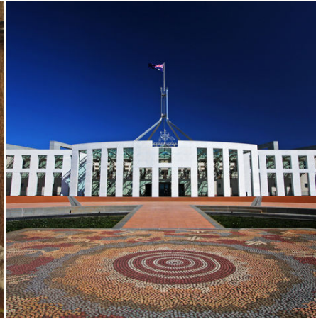
Parlamentsgebäude in Canberra, Australien