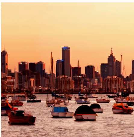
Die Skyline von Melbourne in der Abenddämmerung, Australien