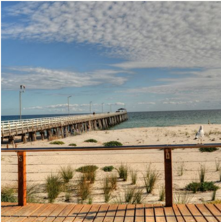
Strand in Adelaide, Australien