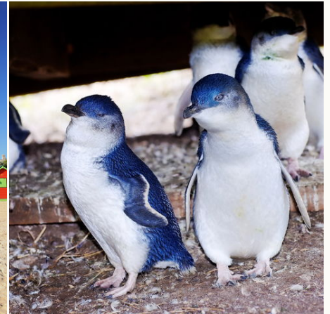
Pinguine auf Phillip Island, Australien