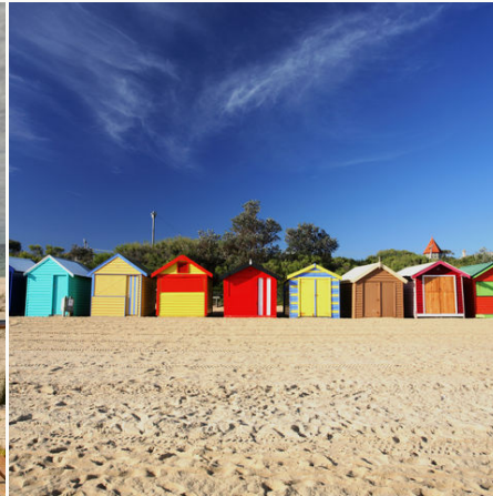
Brighton Beach Boxes, Australien