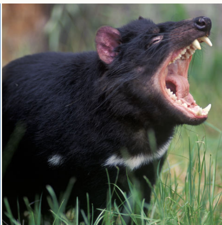
Tasmanischer Teufel, Australien