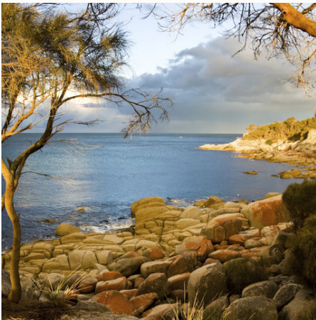
Die Natur ruft, Australien

Tasmanien – kleine Insel, große Vielfalt! Eiszeitliche Landschaften, leuchtend weiße Strände und ein kleiner Teufel der auch über die Grenzen der Insel bestens bekannt ist. Wandern Sie in den zahlreichen Nationalparks: Mount Field, Lake St. Clair oder Cradle Mountain erwarten Sie! Schlendern Sie durch die Städte und kleinen Orte am Wegesrand: mit ihren historischen Gebäuden sind Hobart, Launceston oder Strahan Zeugen Australiens Geschichte. Und zum Abschluss wagen Sie einen Blick "tief ins Glas" im Freycinet Nationalpark: Keine Sorge, die bekannte Wineglass Bay lockt lediglich mit traumhaften Stränden zum Entspannen.