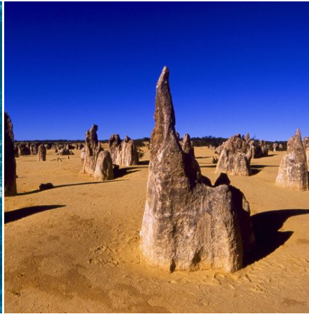
Die Pinnacles in Western Australia, Australien