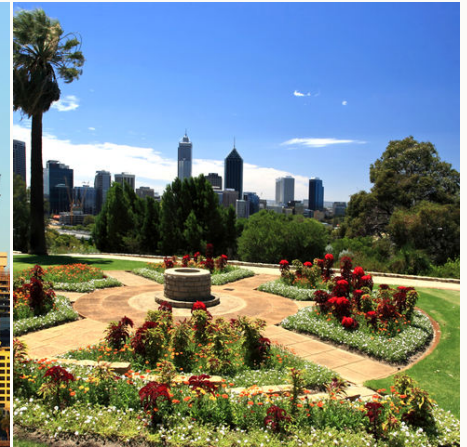
Kings Park in Perth mit Skyline dahinter, Australien