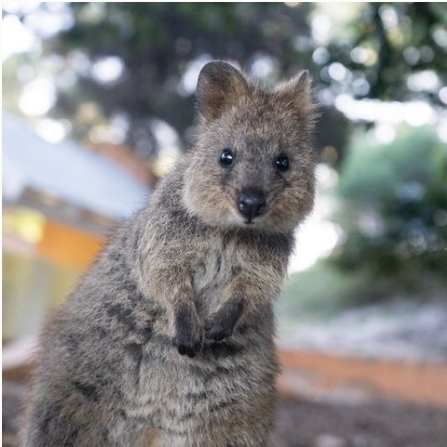
Ein Quokka auf Rottnest Island, Australien