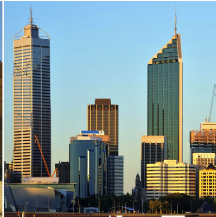
Skyline von Perth, Australien