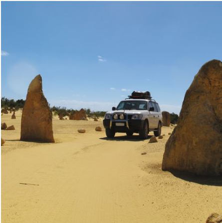
Jepp zwischen den Pinnacles im Nambung Nationalpark, Australien