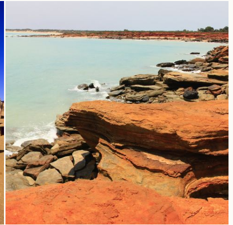
Point Gantheaume in Broome, Australien