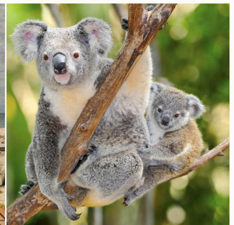
Koala mit Baby im Eukalyptusbaum, Australien