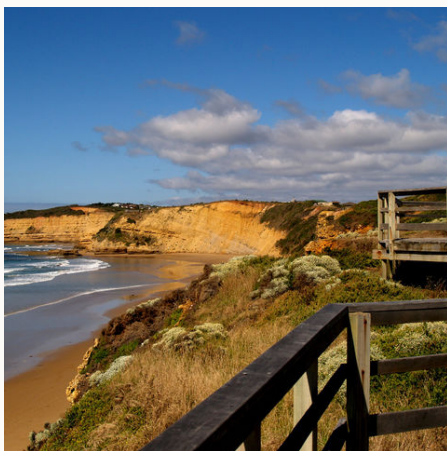
Küste an der Great Ocean Road, Australien