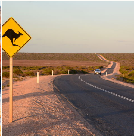
Straße bei Monkey Mia, Australien