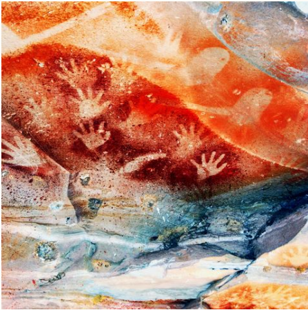
Handmalerei am Carnarvon Gorge, Australien

Der 5. Kontinent lockt Sie mit der Lebensfreude und Heiterkeit der Australier, die ansteckend ist! Gehen Sie in Ihrem Tempo auf Entdeckungsreise in diesem Land voller Naturreichtümer. Die unbekannten Parks, wie Eungella oder Lamington sind genau so beeindruckend wie die großen Highlights, Ayers Rock, Great Barrier Reef und Sydney. Wählen Sie Ihre Favoriten im Tierreich: Koala, Känguru & Kakadu oder vielleicht Wallabie, Kasuar und Quokka? Lassen Sie sich treiben auf Ihrer Reise mit dem Wohnmobil und entscheiden Sie spontan vor Ort wohin es heute gehen soll!