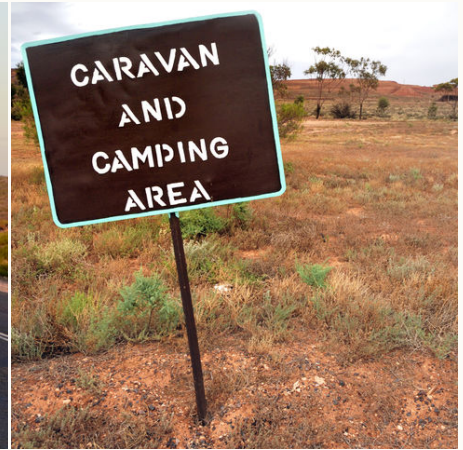
Camping Area, Australien