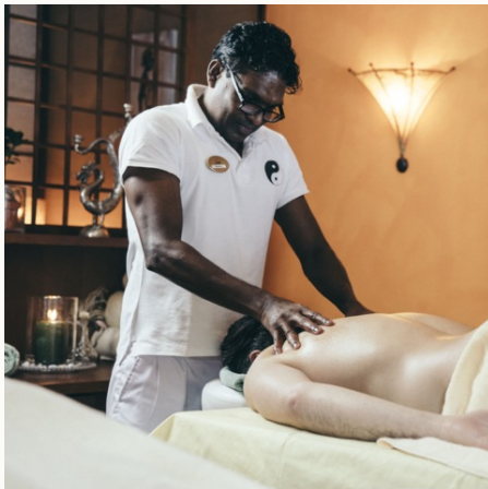
Professionelle Ayurveda-Massage @NEUE WEEGE, Ayurveda

✓ Verfügbar ⚠ Wenige Plätze - Ausgebucht 🛡️ garantierte Durchführung