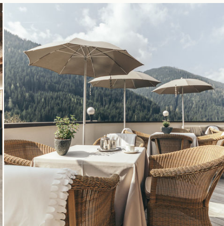
Terrasse mit Blick auf die Dolomiten @NEUE WEGE, Ayurveda