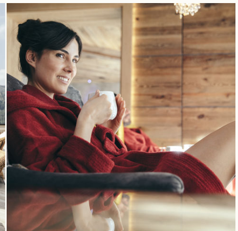
Entspannen bei ayurvedischen Getränken @NEUE WEGE, Ayurveda