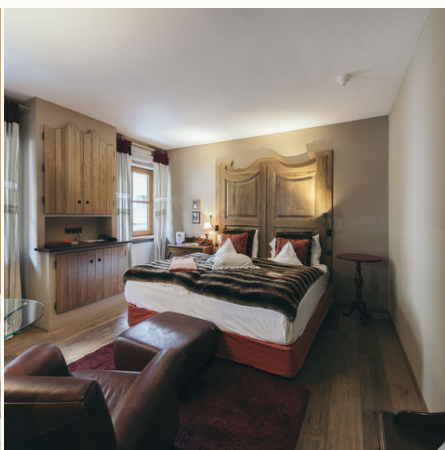
Doppelzimmer im Hotel Engel @NEUE WEGE, Ayurveda