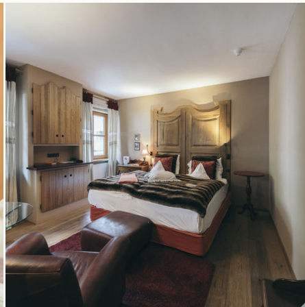
Doppelzimmer im Hotel Engel @NEUE WEEGE, Ayurveda