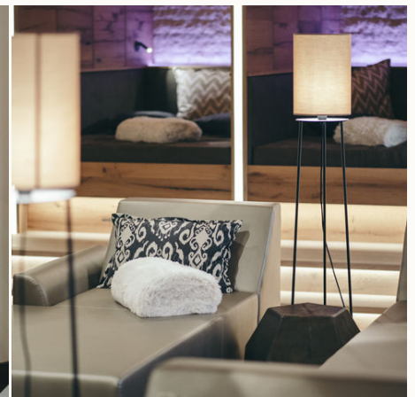
Wellnessbereich mit Liegen @NEUE WEEGE, Ayurveda