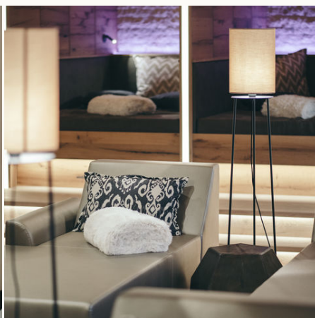
Wellnessbereich mit Liegen @NEUE WEGE, Ayurveda