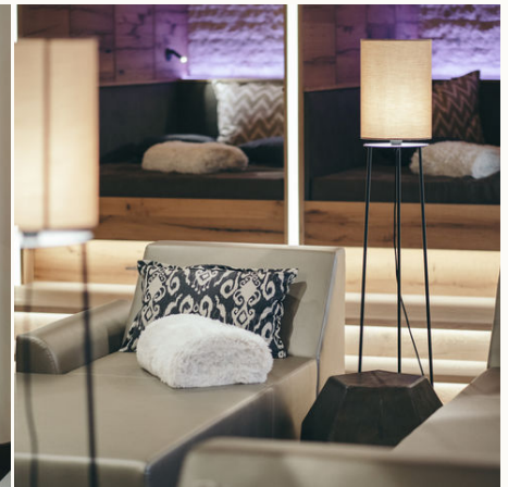
Wellnessbereich mit Liegen @NEUE WEEGE, Ayurveda