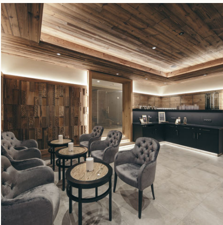
Stylische Einrichtung im Hotel Engel @NEUE WEGE, Ayurveda

Auf Sie persönlich abgestimmte Anwendungen und Gerichte bringen Ihrem Körper und Geist neue Energie,