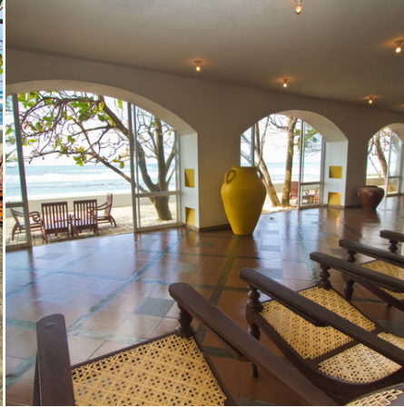
Ausblick auf Strand und Meer, Sri Lanka