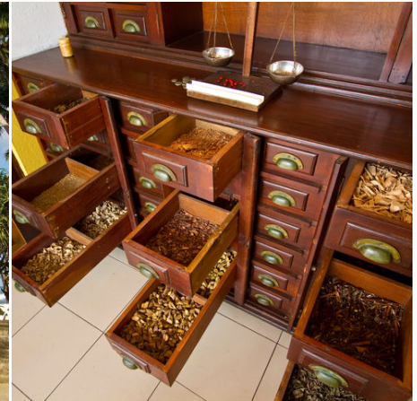
Ayurveda Gewuerze, Sri Lanka