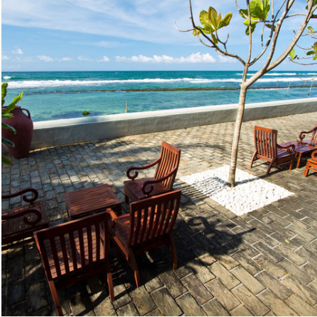
Terrasse am Meer, Sri Lanka

Veranstalter: a&e erlebnis:reisen, eine Marke der Boomerang-Reisen GmbH Stand: 16.12.2025 (PL)