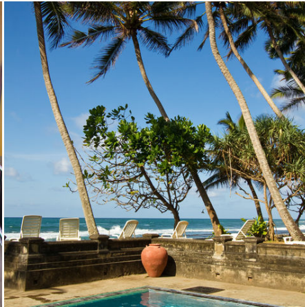
Pool am Meer, Sri Lanka