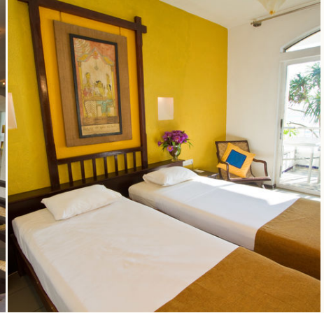
Zimmer mit Balkon, Sri Lanka