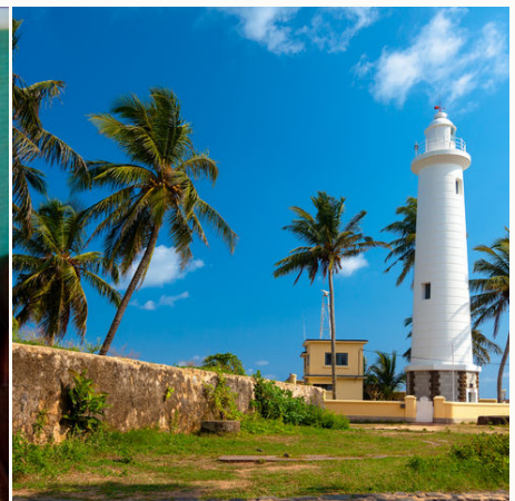
Leuchtturm in Galle, Sri Lanka