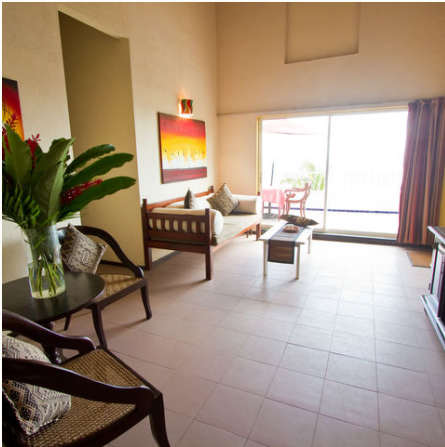
Zimmer in der Mittagssonne, Sri Lanka