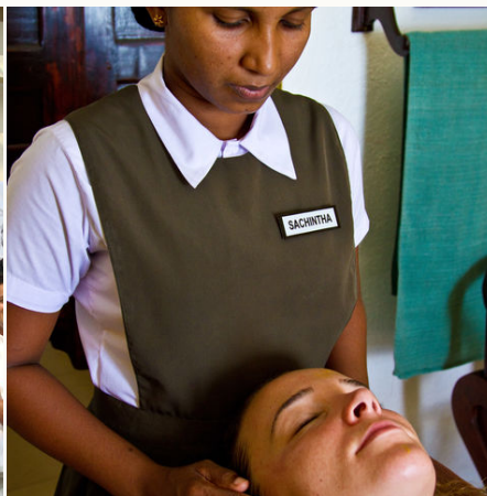
Entspannende Ayurveda-Anwendung, Sri Lanka