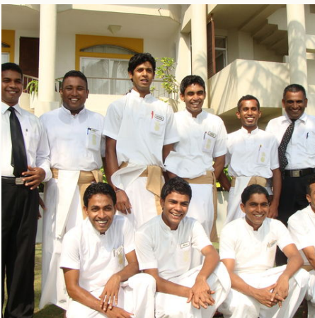
Das Team des Hotels, Sri Lanka

Hier finden Sie mit Sicherheit in die individuelle Balance der Lebensenergien zurück.