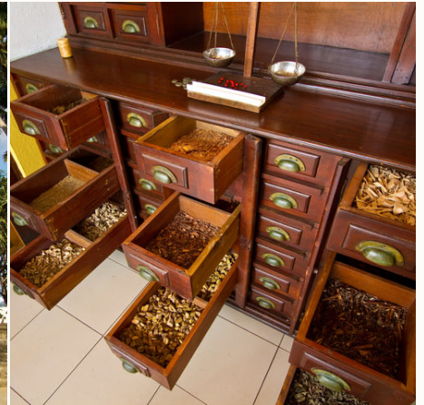
Ayurveda Gewuerze, Sri Lanka