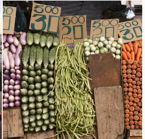
Gemüse auf dem Markt, Sri Lanka