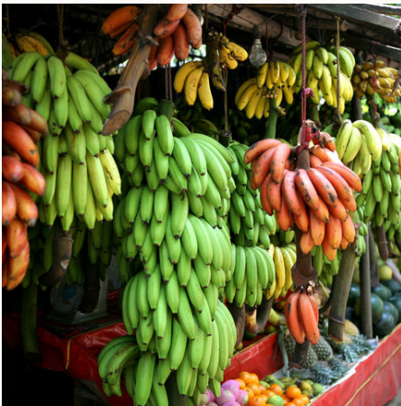
Bananen auf dem Markt, Sri Lanka

Das traditionell-luxuriöse Sithnara Ayurveda Resort zwischen Mirissa und Matara gelegen, begrüßt Sie unter Mangobäumen und Kokospalmen. In dieser ruhigen Idylle erfahren Sie eine an die Panchakarma-Kur angelehnte Ayurveda-Kur, die Ihr Inneres ins Gleichgewicht bringt und Ihren Körper vom Gift des Alltags befreit. Kompetente Ärzte, wohltuende Heilkräuter und die auf Sie abgestimmten Behandlungen unterstützen Sie während Ihres Heilungsprozesses. Ihr Anwesen verfügt über einen kleinen Strand mit natürlichen Badeteichen und Korallenriffen. Die Gartenanlage des ökologisch-nachhaltigen Resorts zieren verschiedene Pflanzen und Bäume, die zum Entspannen und Träumen in ihren Schatten einladen.