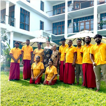
Das freundliche Team des Sithnara Resorts, Sri Lanka