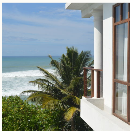
Blick vom Balkon, Sri Lanka

Gerne unterbreiten wir Ihnen natürlich auch ein Angebot für einen längeren Aufenthalt! Sprechen Sie uns an!