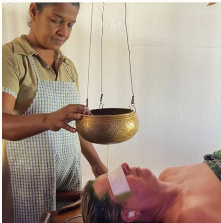
Ayurveda Behandlung im Resort, Sri Lanka