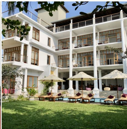
Außenansicht des Sithnara Resorts, Sri Lanka