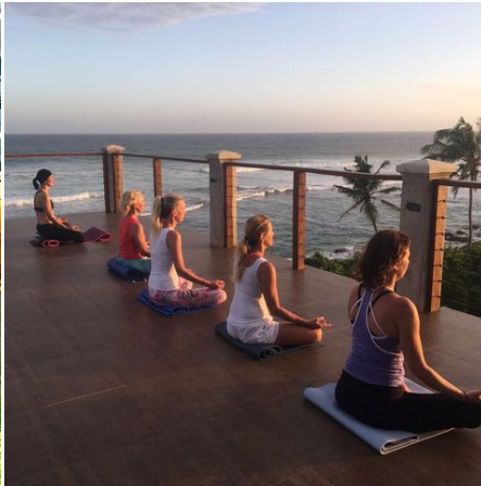
Meditation bei Sonnenuntergang, Sri Lanka