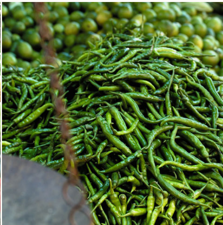
Auf einem Markt, Sri Lanka