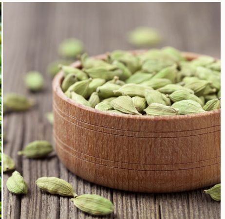
Kardamom, Allgemeine Reisebilder