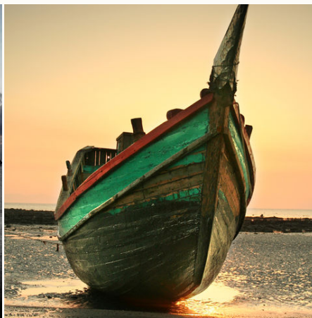
Boot am Strand von St. Martin, Bangladesch