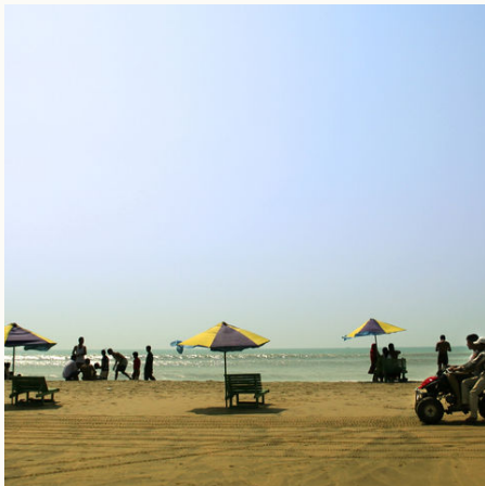
Der Strand von Cox's Bazar, Bangladesch