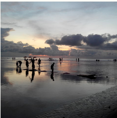
Strand von Cox's Bazar, Bangladesch