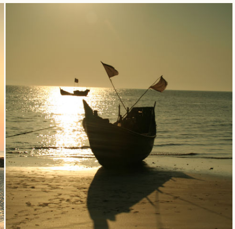
Ein Boot hat auf dem Strand von St. Martin angelegt, Bangladesch