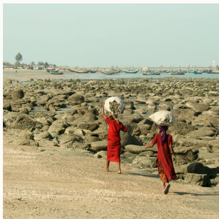
Mädchen am Strand von St. Martin, Bangladesch