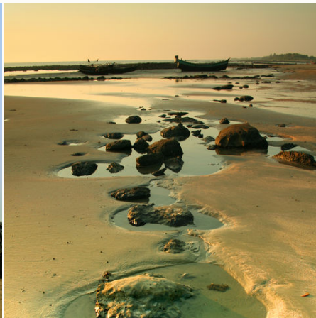
Gestrandete Boote am Sandstrand, Bangladesch