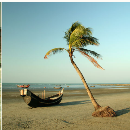
Boot am Strand von St. Martin, Bangladesch