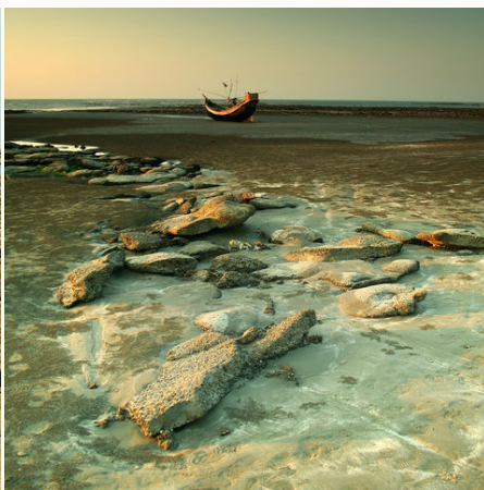
Ein Boot am Strand der Insel St. Martin, Bangladesch