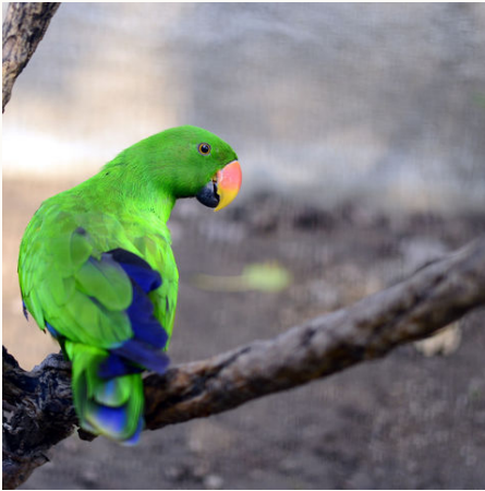
Grüner Papagei, Bangladesch

Lust auf ein Naturabenteuer? Nach dem turbulenten Treiben in der Hauptstadt Dhaka unternehmen Sie eine spannende Kreuzfahrt im größten Flussdelta der Welt! Bei Mongla, an einem Seitenarm des Ganges, gelangen Sie in den Sundarbans-Nationalpark, dem größten Mangrovenwald der Welt, den Sie per Boot erkunden. Genießen Sie die Zeit an Bord und lassen Sie sich von der reichen Tier- und Pflanzenwelt begeistern! Halten Sie die Augen auf, denn vielleicht erblicken Sie den majestätischen bengalischen Tiger, der hier zuhause ist. Mit einem historischen Raddampfer geht es zurück nach Dhaka.