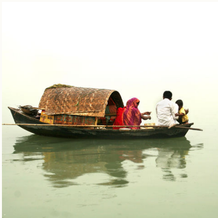
Familie an Bord, Bangladesch