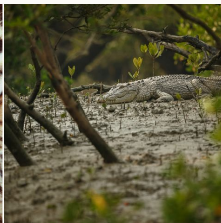
Krokodil in den Sundarbans, Bangladesch