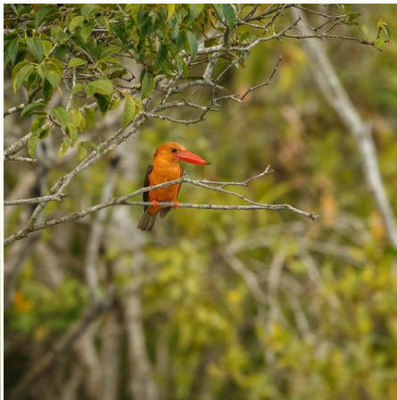
Bunter Königsfischer, Bangladesch