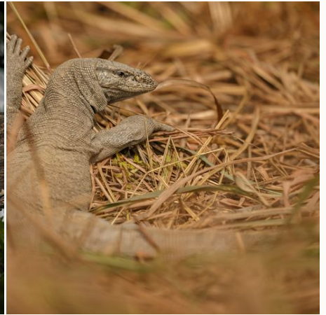
Ein großer Waran im Sundarbans-Nationalpark, Bangladesch