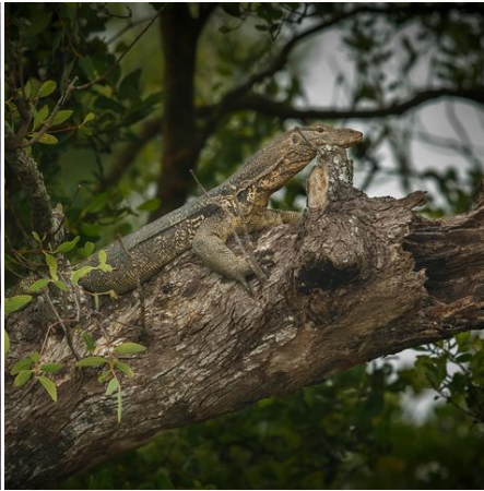
Eine Eidechse auf einem Baum in den Sundarbans, Bangladesch