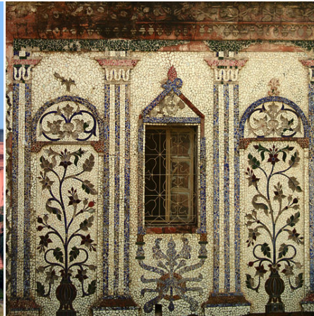
Fenster und farbenfrohe Mosaik in Sonargaon, Bangladesch