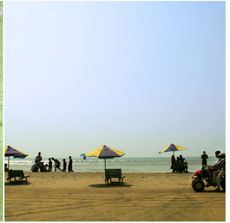
Der Strand von Cox's Bazar, Bangladesch