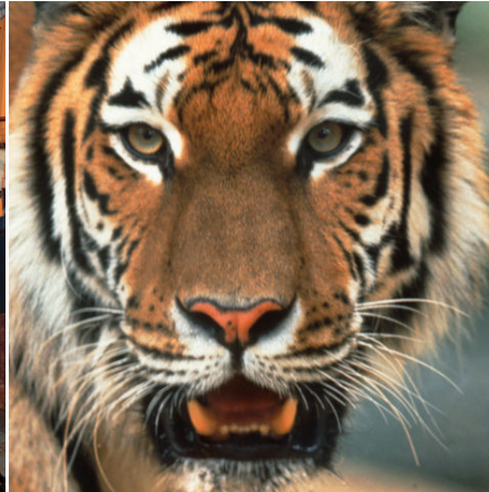
Ausdrucksstarker Tiger, Bangladesch