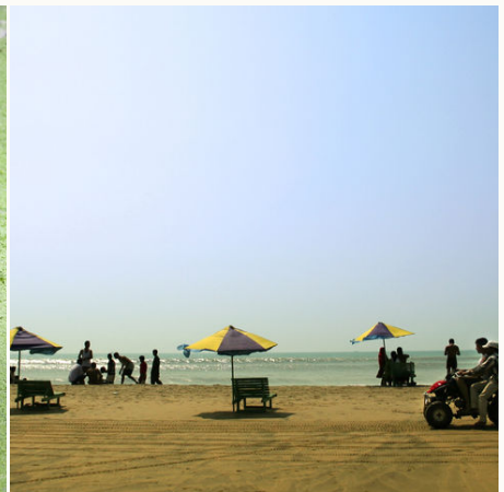
Der Strand von Cox's Bazar, Bangladesch