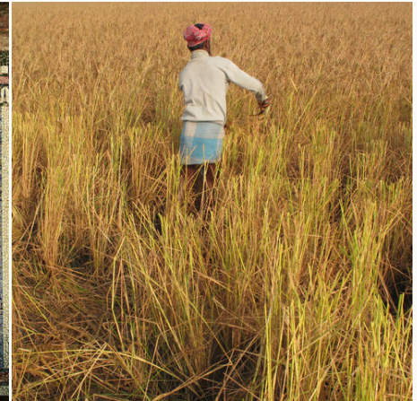
Ein Mann bei der Reisernte, Bangladesch