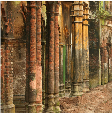
Bunte Wände und Säulen in Sonargon, Bangladesch

Veranstalter: a&e erlebnis:reisen, eine Marke der Boomerang-Reisen GmbH Stand: 25.04.2023 (JL)