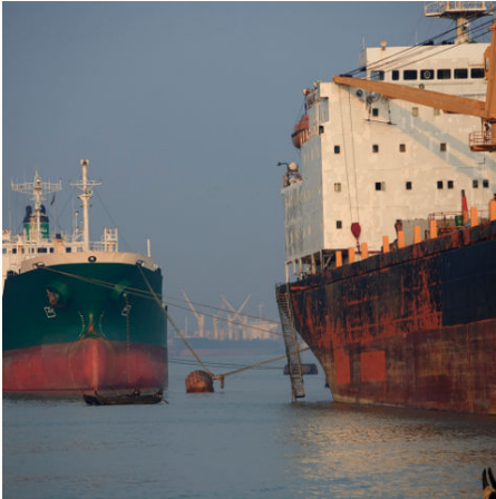
Schiffe im Hafen von Bangladesch, Bangladesch