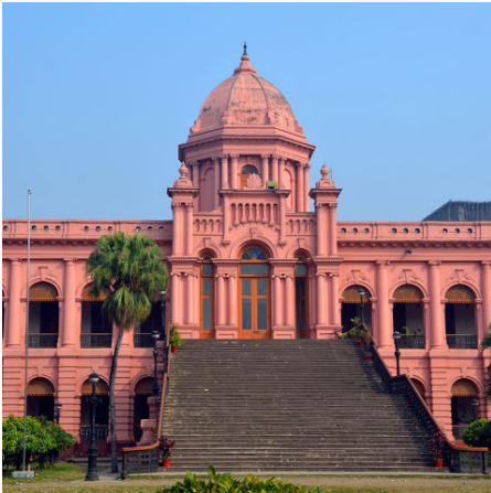
Der pinke Palast Ahsan Manzil, Bangladesch