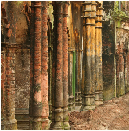
Bunte Wände und Säulen in Sonargon, Bangladesch