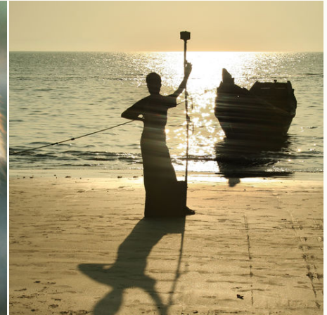
Silhouette eines Fischers am Strand, Bangladesch