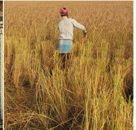
Ein Mann bei der Reisernte, Bangladesch