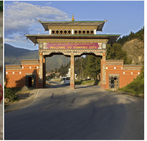
Stadttor der Hauptstadt, Bhutan