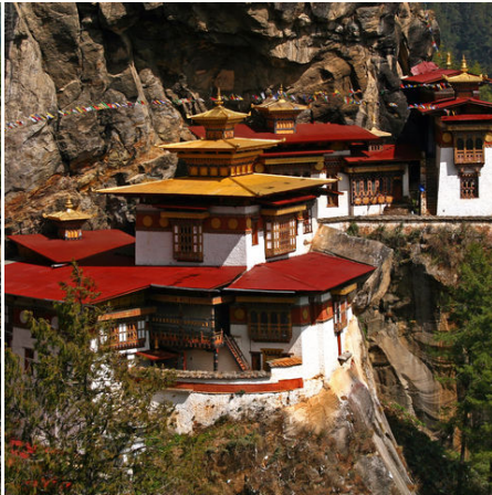
Das Tigernest Kloster, Bhutan