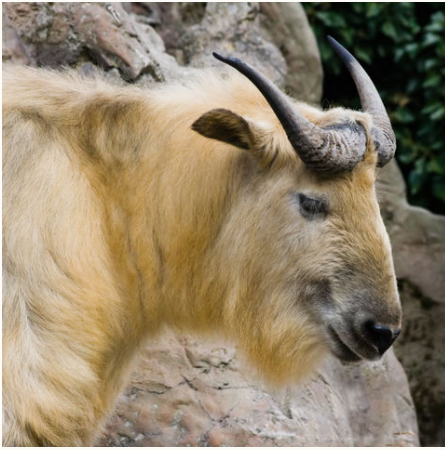
Goldener Takin, Bhutan