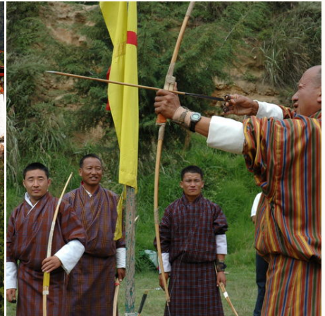
Beim Bogenschießen, Bhutan