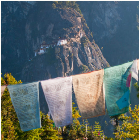
Gebetsflaggen in Paro, Bhutan