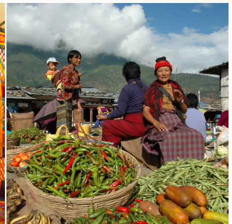
Auf dem Markt, Bhutan