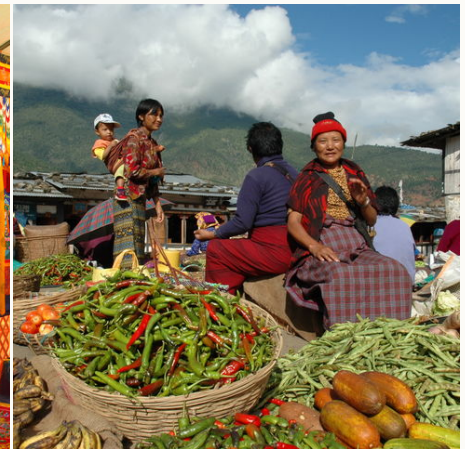
Auf dem Markt, Bhutan