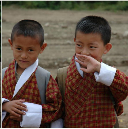
Bhutanesische Schüler, Bhutan