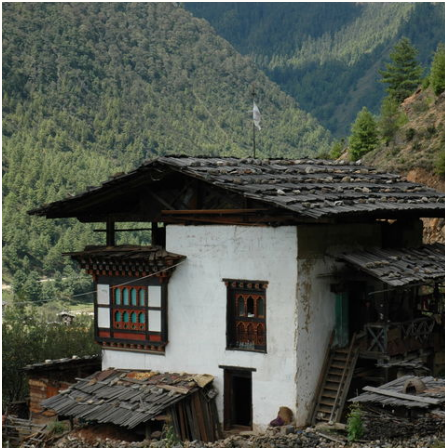
Typisch bhutanische Bauweise, Bhutan