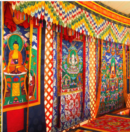
Bunter Wandteppich, Bhutan