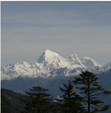
Verschneite Berggipfel, Bhutan