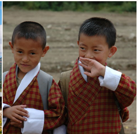
Bhutanesische Schüler, Bhutan