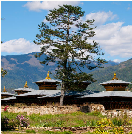
Malerisches Kloster im Bumthang Tal, Bhutan