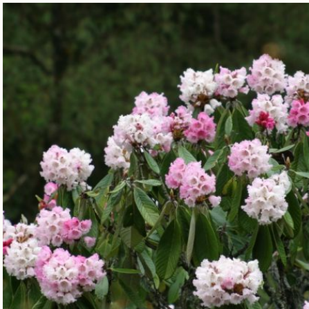
Blühender Rhododendron, Bhutan

Die Durchführung der Reise erfolgt in Zusammenarbeit mit einem befreundeten Veranstalter. Stand: 19.06.2025 (KS)