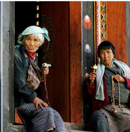
Damen mit Gebetsperlen und Gebetsmühle, Bhutan