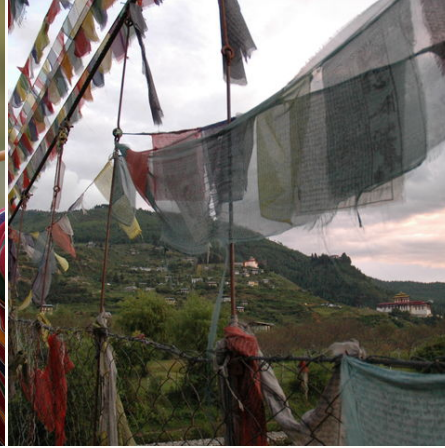
Brücke mit Gebetsfahnen, Bhutan