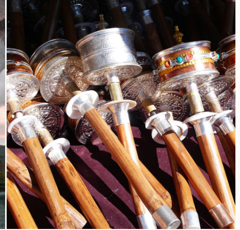
Buddhistische Gebetsmühlen, Bhutan