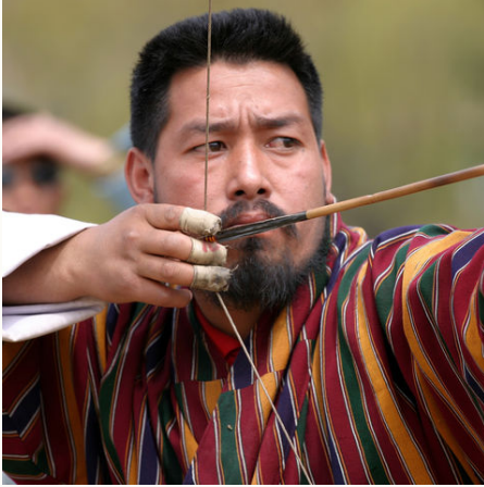
Konzentrierter Bogenschütze, Bhutan

Sie reisen lieber individuell? Diese Bhutan-Reise ist auch als Privatreise ab EUR 8.290,- pro Person buchbar. Durchführung ab 2 Personen mit örtlich wechselnden, englischsprechenden Reiseleitern. Fragen Sie gern Ihre Wunschreise an!