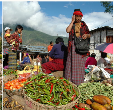
Frisches Gemüse auf dem Markt, Bhutan