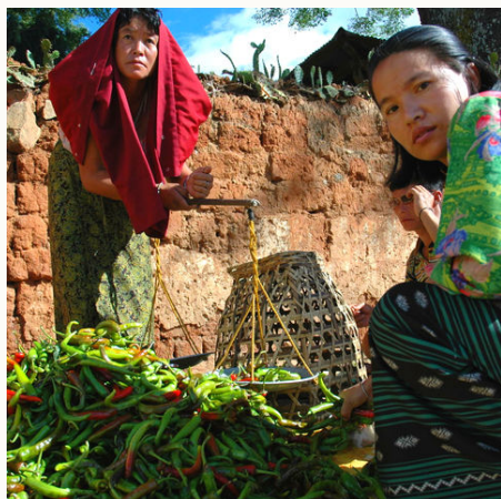
Frauen auf dem Markt, Bhutan