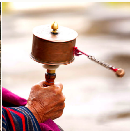
Schwingende Gebetsmühle, Bhutan