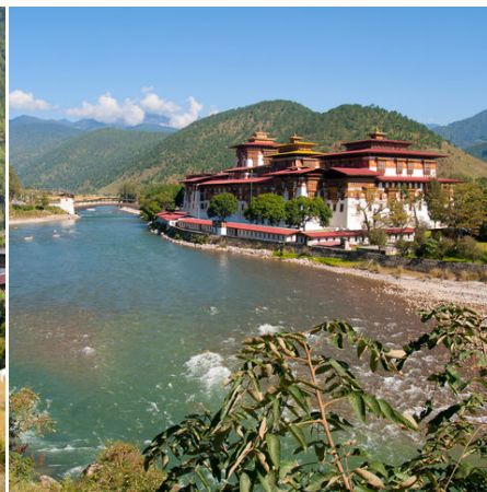
Klosterburg in Punakha am Mo-Chhu-Fluss, Bhutan