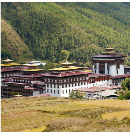
Kloster in Thimpu, Bhutan