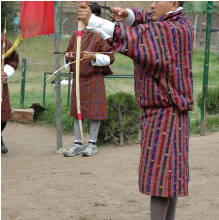
Konzentrierter Bogenschütze, Bhutan