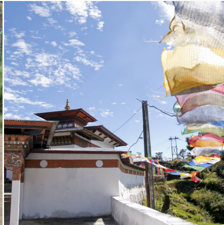
Ein Tempel mit Gebetfahnen, Bhutan