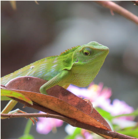
Chamäleon auf einem Ast, Malaysia