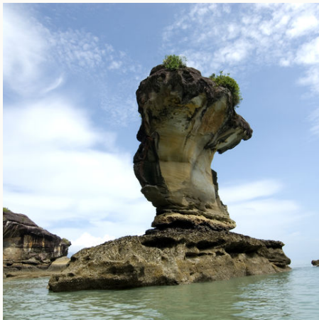
Felsformation im Bako-Nationalpark, Malaysia

Die Wildnis ruft! Sie tauchen bei dieser Borneo Rundreise nach Sarawak in eine Welt voll üppiger Natur, erfrischender Flüsse und interessanter Menschenaffen ein. Lassen Sie sich von den Geräuschen des Regenwaldes wecken, während die Nasenaffen spielend durch die Bäume schwingen und Vögel lautstark nach Futter suchen. Beobachten Sie die seltenen Irrawaddy-Delfine in ihrer natürlichen Umgebung und wandern Sie an den schönen Stränden im Bako-Nationalpark. Erleben Sie hautnah die Kultur der Iban bei einem Dorfbesuch. Der kleine Ort mit seinen faszinierenden Bambus- und Holzhütten liegt inmitten von Plantagen, auf denen die Bewohner Reis, Pfeffer, Obst und weitere exotische Köstlichkeiten anbauen.