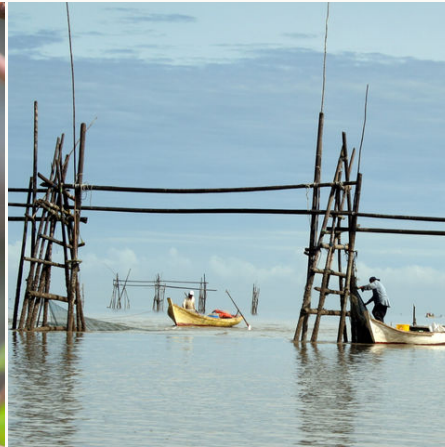
Fischer im Bako-Nationalpark, Malaysia