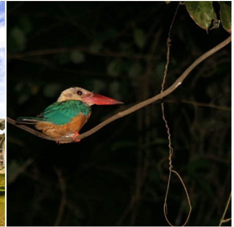
King Fisher Vogel, Malaysia