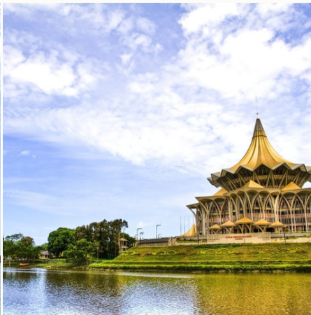
Der Astana-Palast am Sarawak-Fluss in Kuching, Malaysia