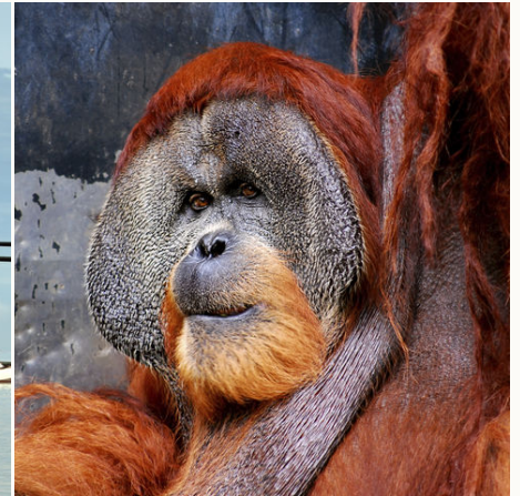
Ein Orangutan, Malaysia