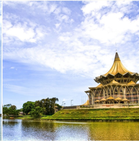
Der Astana-Palast am Sarawak-Fluss in Kuching, Malaysia