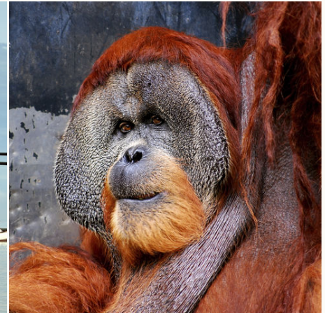
Ein Orangutan, Malaysia