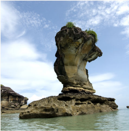
Felsformation im Bako-Nationalpark, Malaysia

Die Wildnis ruft! Sie tauchen bei dieser Borneo Rundreise nach Sarawak in eine Welt voll üppiger Natur, erfrischender Flüsse und interessanter Menschenaffen ein. Lassen Sie sich von den Geräuschen des Regenwaldes wecken, während die Nasenaffen spielend durch die Bäume schwingen und Vögel lautstark nach Futter suchen. Beobachten Sie die seltenen Irrawaddy-Delfine in ihrer natürlichen Umgebung und wandern Sie an den schönen Stränden im Bako-Nationalpark. Erleben Sie hautnah die Kultur der Iban bei einem Dorfbesuch. Der kleine Ort mit seinen faszinierenden Bambus- und Holzhütten liegt inmitten von Plantagen, auf denen die Bewohner Reis, Pfeffer, Obst und weitere exotische Köstlichkeiten anbauen.