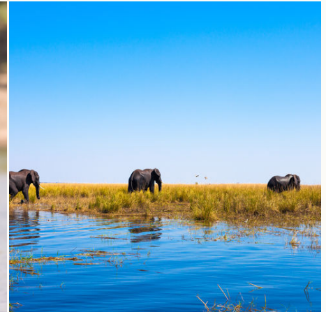
Elefanten im Okavango Delta, Botswana