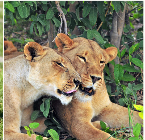
Schmusende Löwen, Botswana