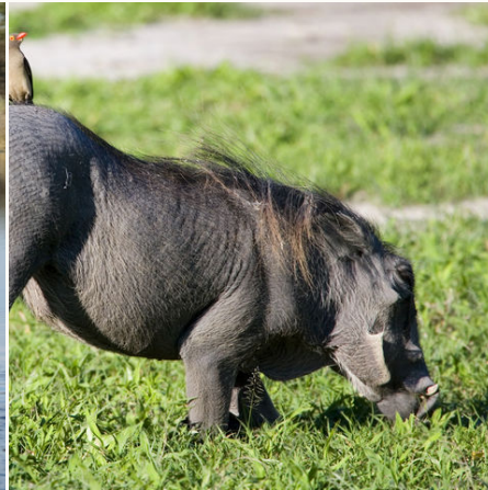
Schnüffelndes Warzenschwein, Botswana