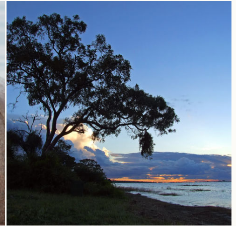
Sonnenuntergang am Chobe River, Botswana