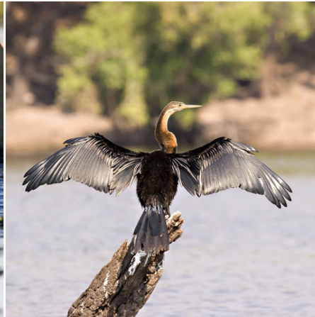
Afrikanischer Schlangenhalsvogel, Botswana