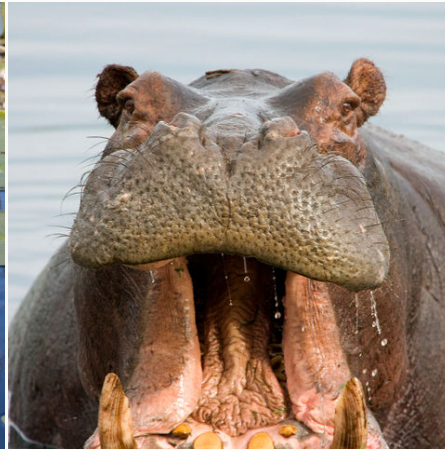
Was für ein Anblick, Botswana