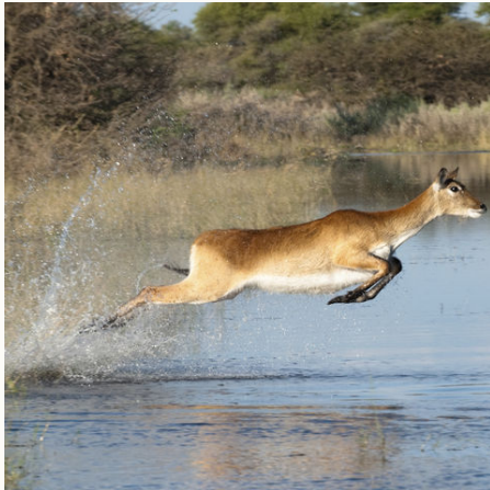
Auf der Flucht im Okavango Delta, Botswana