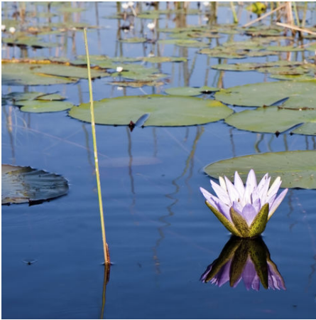
Wasserlilie im Okavango Delta, Botswana

Die bunte Vielfalt Afrikas erwartet uns! Auf dieser Rundreise lernen wir das Okavangodelta mit seiner artenreichen Tier- und Pflanzenwelt kennen. Wir verfolgen auf spannenden Safaris die Spuren von Elefanten, Nilpferden, Büffeln, Löwen und Co., vom Fahrzeug oder im traditionellen Boot. Neben wilden Tieren lächeln auch Einheimische in unsere Kameras und wir fangen die Panoramen, die uns die atemberaubenden Natur bietet, ein. Eindrucksvoll, lehrreich und einmalig präsentiert sich uns auf dieser 2-wöchigen Reise die Ursprünglichkeit Botswanas.