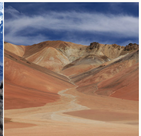
Malerische Landschaft der Atacama Wüste, Chile