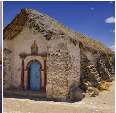
Lehmkirche im Parinacota Dorf des Lauca Nationalpark, Chile