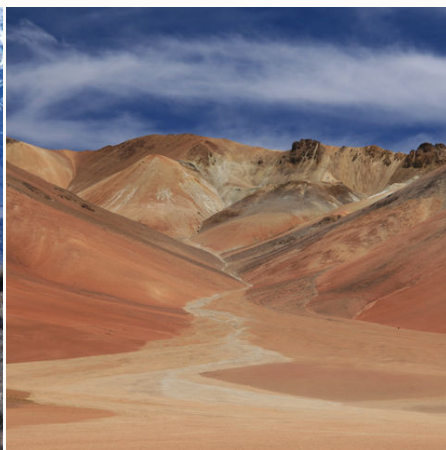
Malerische Landschaft der Atacama Wüste, Chile