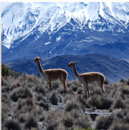
Vicuñas im Lauca Nationalpark, Chile