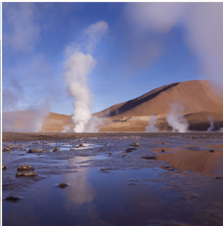
Geysire in der Atacama Wüste, Chile