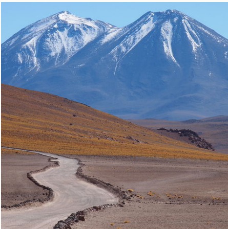
Weg in der Atacama Wüste, Chile

Per Mietwagen durchstreifen Sie den kontrastreichen Norden Chiles: Entdecken Sie rosa Flamingos im Salar de Atacama, Relikte aus der Salpeterzeit bei Iquique & traditionelle Dörfer und den Lago Chungará im abgeschiedenen Andenhochland – Heimat der Aymara-Kultur. Eine Chile-Reise, bei der Sie die Highlights des Nordens selbst erfahren und an palmenbesäumten Stränden die Seele baumeln lassen können.