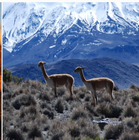
Vicuñas im Lauca Nationalpark, Chile