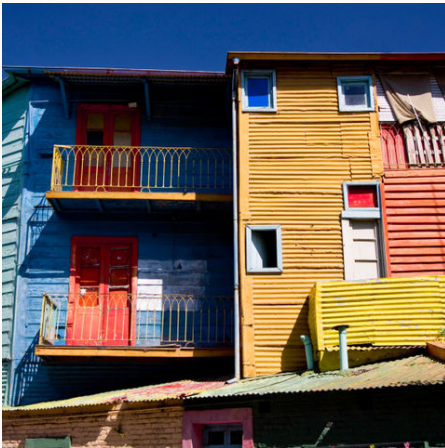
Die bekannte Caminito Straße in Buenos Aires, Argentinien