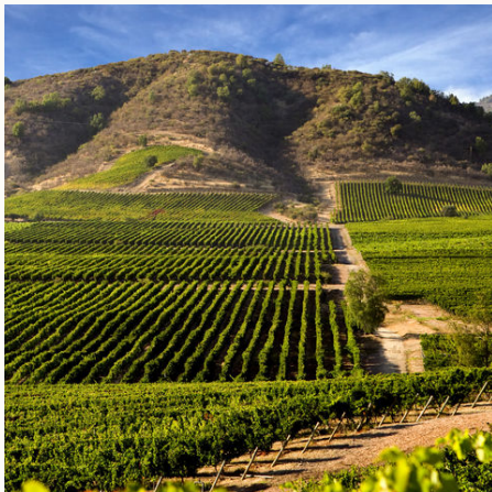
Grüne Weinbauregion, Chile

Die Durchführung der Reise erfolgt in Zusammenarbeit mit einem befreundeten Veranstalter. Stand: 15.01.26 (HC)