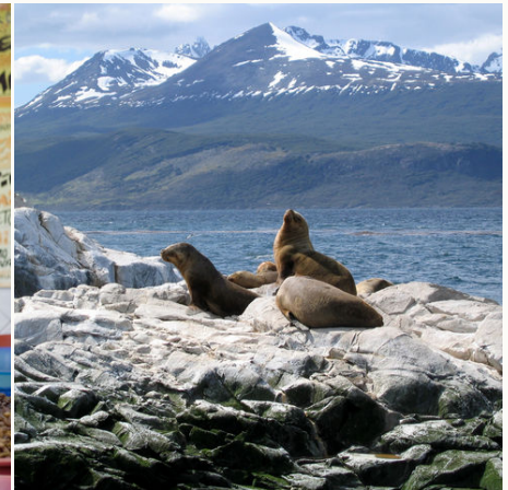
Seelöwen auf Felsen am Beagle Kanal, Chile