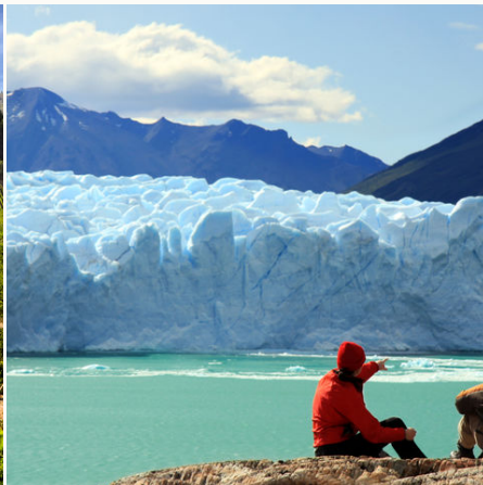
Blick auf den Perito Moreno Gletscher im Los Glaciares Nationalpark, Argentinien