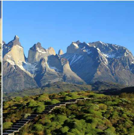
Cuernos del Paine im Torres-del-Paine-Nationalpark, Chile