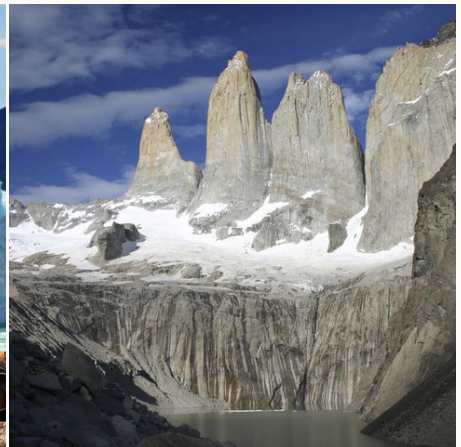
Felsige Torres Spitzen des Torres del Paine, Chile