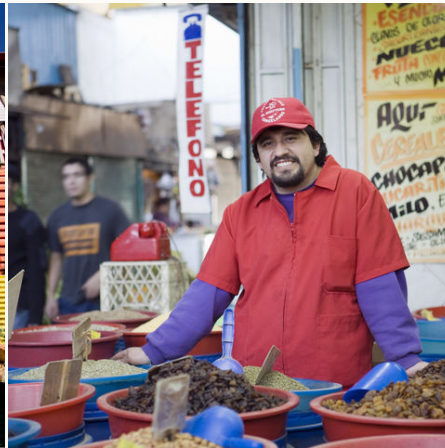
Verkäufer in Santiago de Chile, Chile