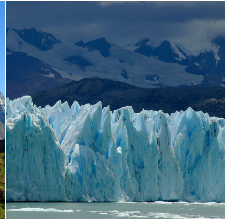
Eisblauer Perito-Moreno-Gletscher, Argentinien