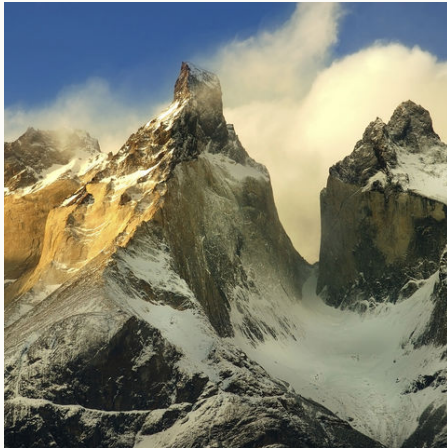
Mirador Cuernos im Torres del Paine Nationalpark, Chile

✓ Verfügbar ! Wenige Plätze - Ausgebucht ✓ garantierte Durchführung