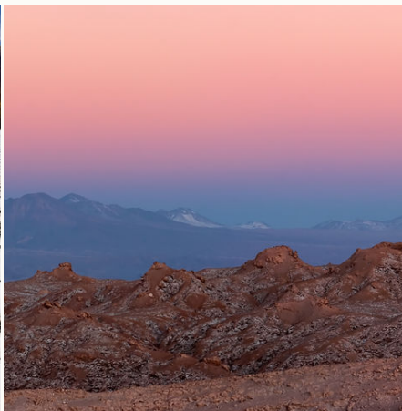
Blick auf die Atacama-Wüste in den Anden, Chile