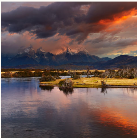
Sonnenaufgang im Torres del Paine Nationalpark, Chile