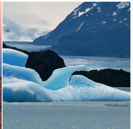
Eisschollen am Grey-Gletscher, Chile