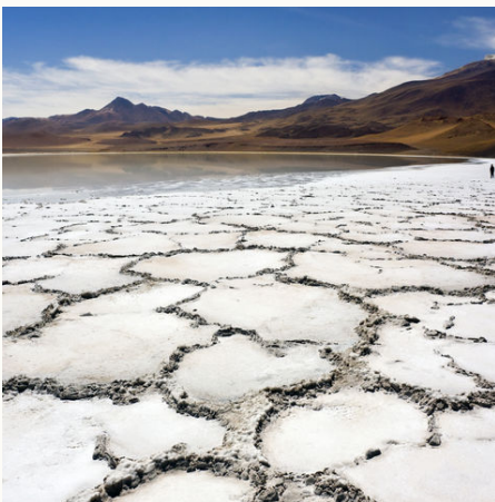
Tuyajto-Lagune und Salzkrusten, Chile

Wir fahren nach Patagonien, in die Seenregion und in die Atacama-Wüste und erleben begeisternde Begegnungen mit den Einheimischen dieses vielfältigen Landes. Dabei werden wir teilhaben an den Bräuchen und Traditionen der chilenischen Ureinwohner und lernen das Leben deutscher Einwanderer der fünften Generation kennen. Im Torres-del-Paine-Nationalpark erwandern wir einige der Highlights der chilenischen Natur, bevor wir in Valparaíso die bunte Hafenstadt erkunden.