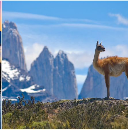
Guanako auf einem Berg im Torres del Paine Nationalpark, Chile