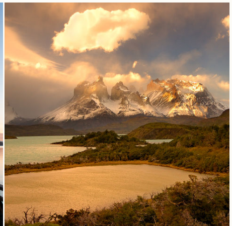
Sonnenuntergang im Torres del Paine Nationalpark, Chile