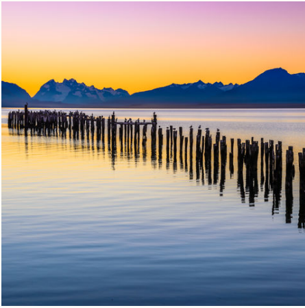
Sonnenuntergang in Puerto Natales, Chile