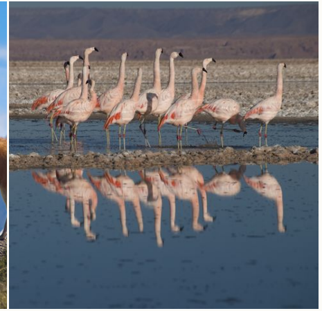
Flamingos in der Laguna Chaxa, Chile