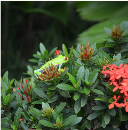
Rotaugenlaubfrosch, Costa Rica