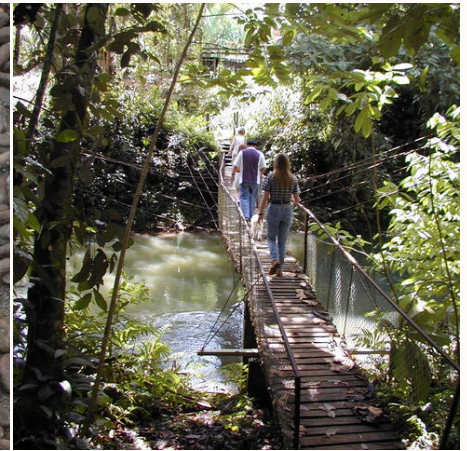
Kleine Hängebrücke in der Gegend um Sarapiquí, Costa Rica