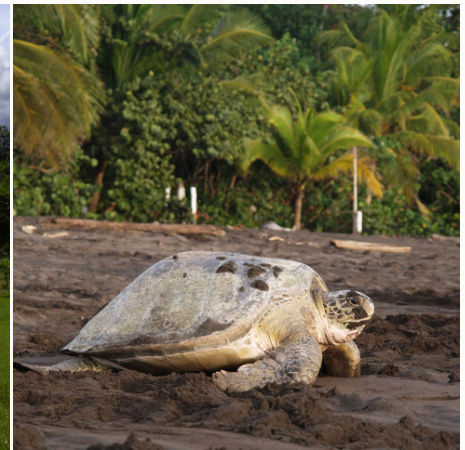
Meeresschildkröte im Tortuguero-Nationalpark, Costa Rica