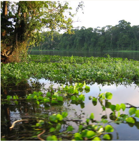
Wasserlilien, Costa Rica

Bitte beachten Sie, dass es bei Reisen z.B. über Weihnachten / Silvester und Ostern zu Hochsaison-Aufpreisen kommen kann. Gerne machen wir Ihnen auf Anfrage ein konkretes Angebot für diesen Zeitraum.