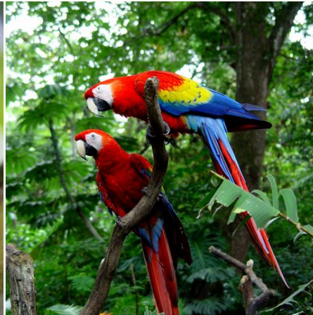
Rote Aras, Costa Rica