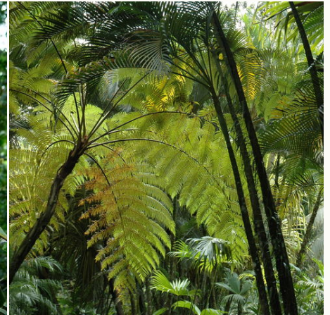
Dichter Regenwald, Costa Rica