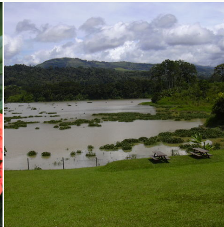
Grüne Landschaft in Turrialba, Costa Rica