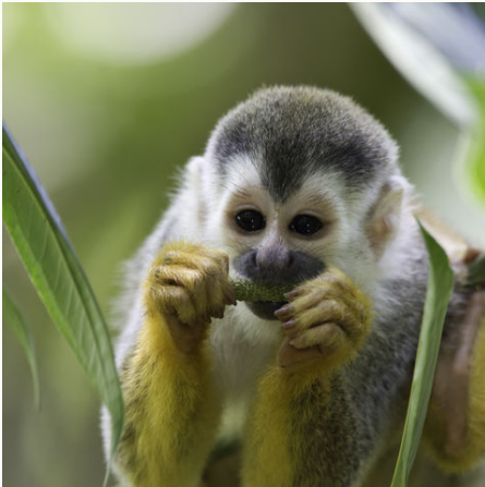
Totenkopffaffe, Costa Rica