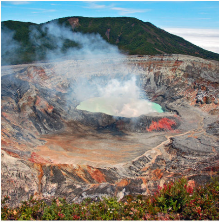
Rauchender Krater des Vulkans Poás, Costa Rica