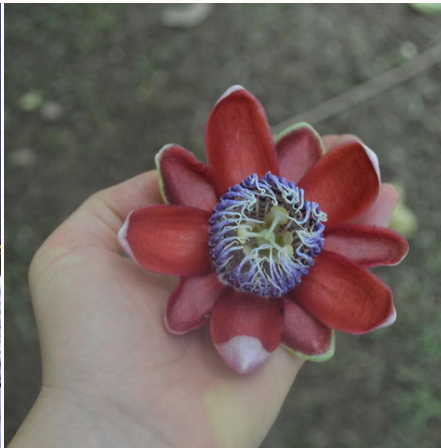
Exotische Blüte, Costa Rica