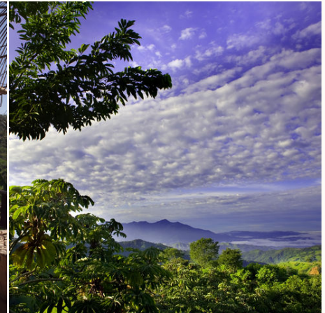
Einzigartige Natur, Costa Rica