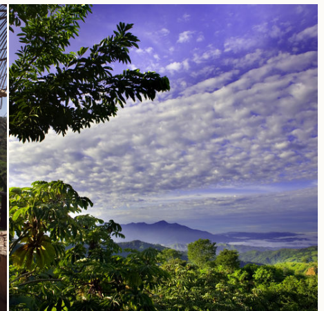
Einzigartige Natur, Costa Rica