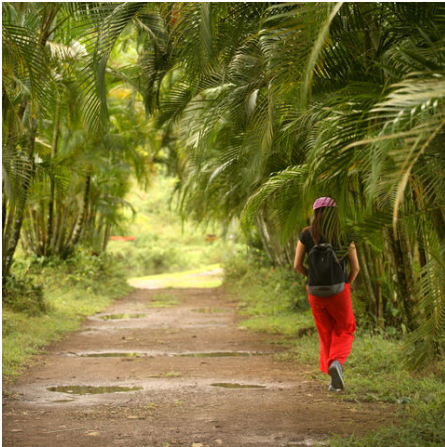
Spaziergang unter Palmen, Costa Rica