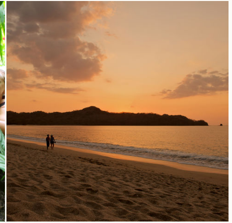
Traumhafter Sonnenuntergang am Strand, Costa Rica