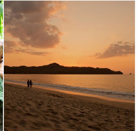
Traumhafter Sonnenuntergang am Strand, Costa Rica