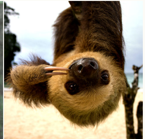
Süßes Faultier im Cahuita-Nationalpark, Costa Rica