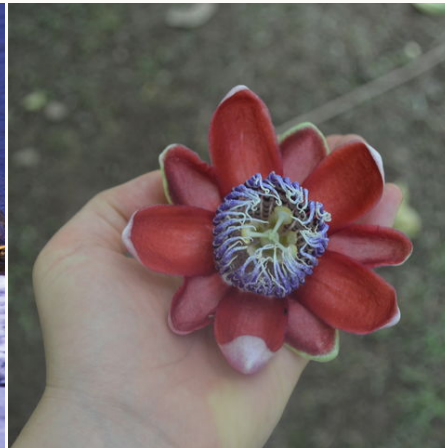
Exotische Blüte, Costa Rica