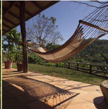
Entspannung in einer Hängematte, Costa Rica