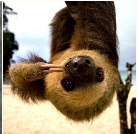
Süßes Faultier im Cahuita-Nationalpark, Costa Rica