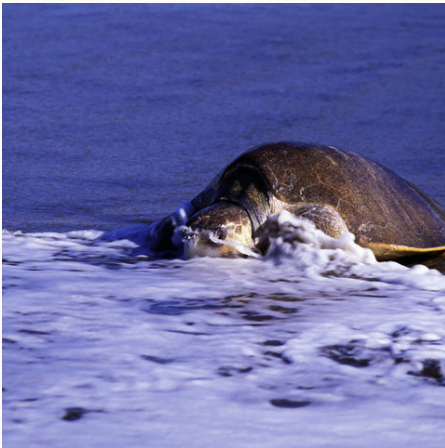
Meeresschildkröte am Strand im Wasser, Costa Rica

Auf unserer Costa Rica Rundreise zu den bekannten und unbekannten Highlights Costa Ricas begegnen uns faszinierende Landschaften und gastfreundliche "Ticos", wie sich die Costa Ricaner liebevoll selbst nennen. Wir kosten erstklassigen Kaffee in bezaubernder Umgebung und genießen fantastischen, handgemachten Kakao. Mit dem Boot erkunden wir die Isla de Chira, pflanzen Mangrovenbäume, beobachten Pelikane, Seealder und Krokodile, bevor wir unter dem Sternenhimmel die Augen schließen. Auf einer Wanderung im Waldreservat Monte Alto bewundern wir Orchideen und die Artenvielfalt. Am schönsten Strand des Landes "Carillo" genießen wir unsere Zeit und lassen die See baumeln, bevor uns der Vulkan Arenal staunen lässt. Zu Gast bei den Bribri-Indianern erfahren wir mehr über Heilpflanzen und die Mythologie des Volkes. Wir genießen das Hier und Jetzt an Traumstränden und in atemberaubender Natur.