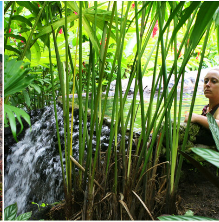
Tropische heiße Quellen, Costa Rica