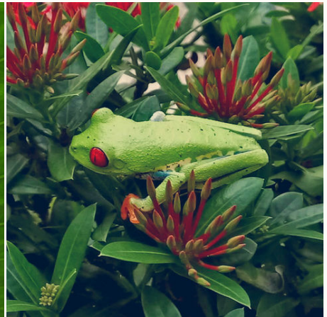
Rotaugenlaubfrosch auf einem blühenden Strauch, Costa Rica