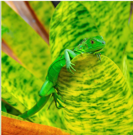
Junger grüner Leguan, Costa Rica