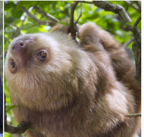
Ein im Baum hängendes Faultier, Costa Rica