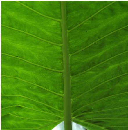
Sattes Grün, Costa Rica