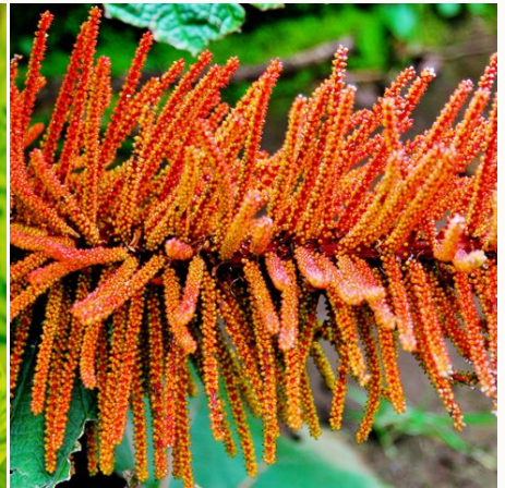
Eine der größten Pflanzen der Welt, Costa Rica