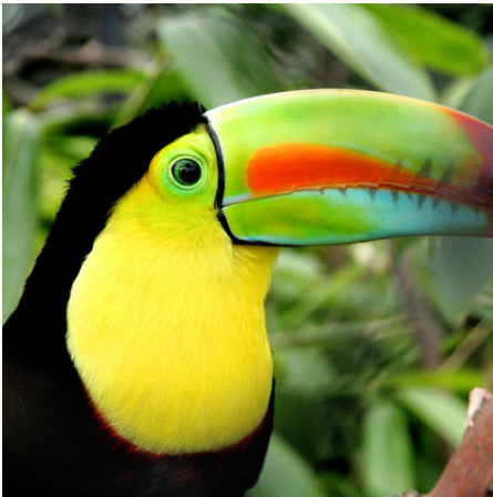
Strahlender Tukan, Costa Rica

Sehnen Sie sich nach einem unvergesslichen Aufenthalt im Herzen des Regenwaldes? Dann ist diese Tour genau das Richtige für Sie! Fünf Tage Naturerlebnis pur in zwei atemberaubenden Gegenden mit fesselnden Panoramen und frischem Grün. Sie erkunden ein Ambiente von großer naturgeschichtlicher Bedeutung. Unterwegs in beeindruckenden Regenwäldern vergessen Sie die Alltagssorgen. Genießen Sie die Nähe der Bäume und klettern Sie auf deren höchste Äste oder unternehmen Sie eine gemütliche Bootsfahrt durch die Kanäle von Tortuguero, wo unter anderem Drachenblut- und Cativo-Bäume ihre Schatten aufs ruhige Wasser werfen. Entspannen Sie im Schaukelstuhl mit Blick auf den Fluss und nippen Sie dabei an einem kühlen Getränk. Romantische Abendessen bei Kerzenlicht zu den sanften Geräuschen der Natur sind ebenfalls Teil dieser unvergesslichen Tour, auf der Sie viel neue Energie tanken können.