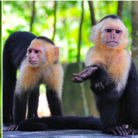
Klammeraffen, Costa Rica