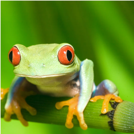
Schau mir in die Augen, Kleines!... Ein Rotalgenlaubfrosch, Costa Rica