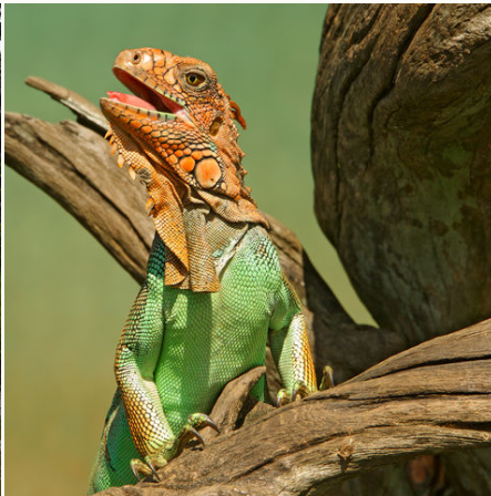
Majestätischer Leguan, Costa Rica