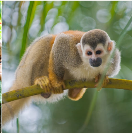
Totenkopffaffen auf einem Ast, Costa Rica