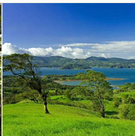
Der Arenalsee, Costa Rica