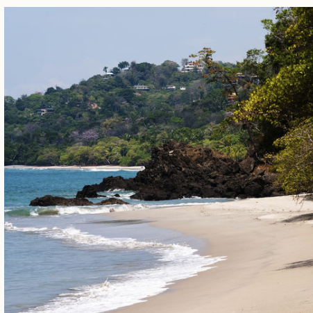
Strand, Costa Rica

✓ Verfügbar ! Wenige Plätze - Ausgebucht ✓ garantierte Durchführung