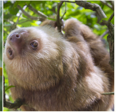
Ein im Baum hängendes Faultier, Costa Rica