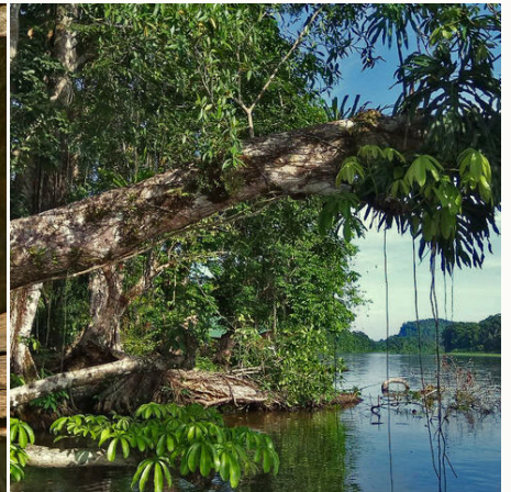
Idyllische Flusslandschaft, Costa Rica