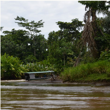
Bootsfahrt im Caño-Negro-Schutzgebiet, Costa Rica