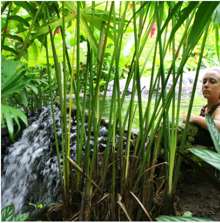
Tropische heiße Quellen, Costa Rica