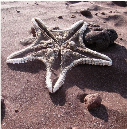
Ein Seestern auf den Galapagos, Ecuador

Mangrovengesäumte weiße Sandstrände, geheimnisvolle Vulkanlandschaften und eine endemische Tier- und Pflanzenwelt: Galápagos ist ein Paradies für Entdecker und Naturliebhaber! Gehen Sie auf Tuchfühlung mit Seelöwen und Riesenschildkröten, schwimmen Sie mit Pinguinen und begegnen Sie den urzeitlich anmutenden Meeresechsen – die ursprüngliche und spektakuläre Fauna wird Sie in ihren Bann ziehen. Die Vulkan-Inseln im Pazifik haben eine ungestörte Entwicklung von mehr als fünf Millionen Jahren durchlaufen und zählen heute zum UNESCO-Weltnaturerbe. Tauchen Sie ein in die atemberaubende und urtümliche Welt des Galápagos-Archipels!