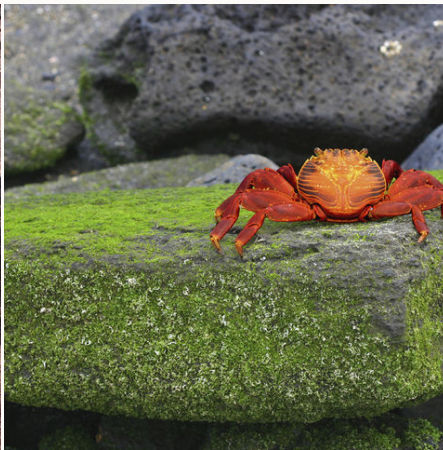
Eine feuerrote Krabbe, Ecuador