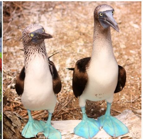
Blaufußtölpel auf den Galapagos Inseln, Ecuador