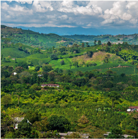
Blick auf die Kaffeeregion, Kolumbien