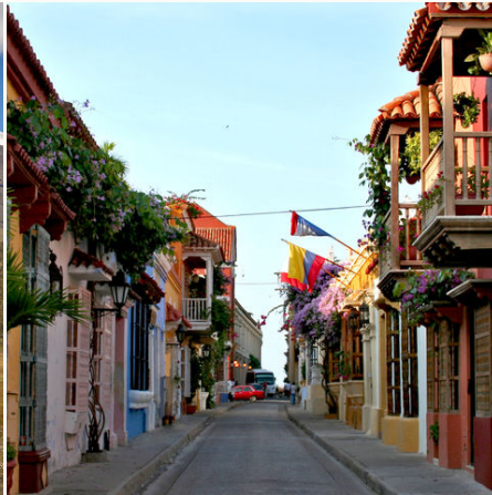
Kleine bunte Straße in Cartagena, Kolumbien