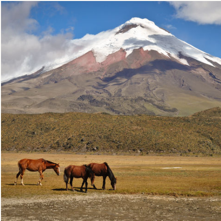
Wildpferde vor dem Cotopaxi Vulkan, Ecuador