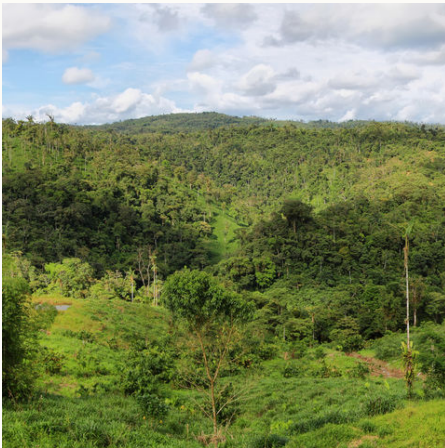
Dschungel in Tena, Ecuador

Durch fast alle Vegetationszonen, vom üppigen Bergnebelwald über den immergrünen Amazonas bis zu den schneebedeckten Vulkanlandschaften der Anden. An paradiesischen Sandstränden die Seele baumeln lassen, auf indigenen Märkten bummeln, durch die Gassen von Städten mit Kolonialflair schlendern. Diese abwechslungsreiche Rundreise zeigt uns die Vielfalt Südamerikas! In Kolumbien genießen wir traumhafte Ausblicke in Bogotá, sind zu Gast bei Kaffeebauern in der „Zona Cafetera“ und bei den Kogies mitten im Dschungel. Wir durchstreifen das Naturparadies des Tayrona Nationalparks und lauschen den heißen Rhythmen der Cumbia-Musik in Cartagena de Indias. In Ecuador schwingen wir beim Salsa-Kurs das Tanzbein und erfahren im Cotopaxi Nationalpark was es bedeutet dem Himmel so nah zu sein. Schließlich starten wir unseren Landeanflug auf die Galápagos Inseln und lassen uns von Darwins Wunderwelten verzaubern!