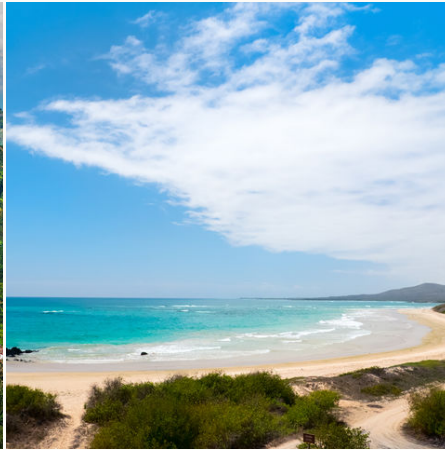
Ein Strandtag auf der Galápagos Insel Isabela, Ecuador