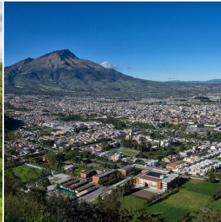
Blick auf Ibarra, Ecuador