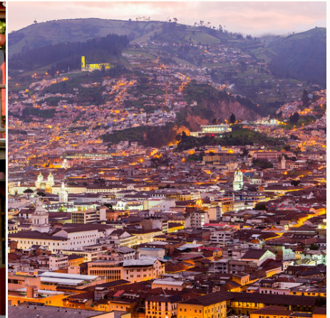
Das historische Zentrum von Quito, Ecuador