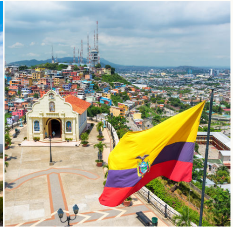
Flagge auf dem Hügel Santa Ana in Guayaquil, Ecuador