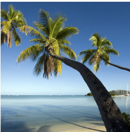
Palmen direkt am Wasser, Fiji

Weißer Sandstrand trifft auf klares, türkisfarbenes Meer und die fijianische Gastfreundschaft verbreitet ansteckende Lebensfreude! Ein Aufenthalt auf den Fiji-Inseln bietet sich beispielsweise als ideale Verlängerung nach einer Rundreise durch Neuseeland oder Australien an. Gerne organisieren wir Ihnen auf den Fiji-Inseln neben den Flügen, Transfers und Unterkünften auch Ausflüge und Aktivitäten wie zum Beispiel den Besuch eines Dorfes oder eine Wanderung im Nationalpark. Sprechen Sie uns an!