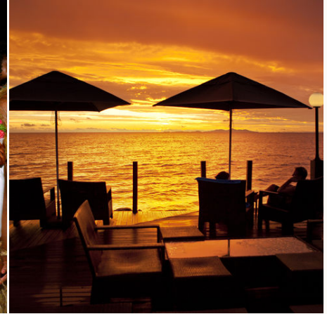
Sonnenuntergang am Ozean, Fiji