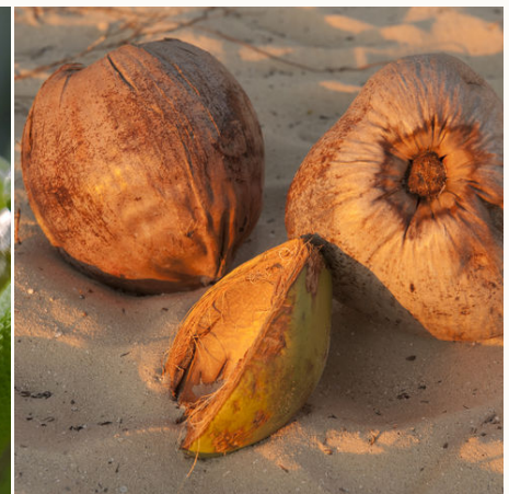
Kokosnüsse im Sand, Fiji