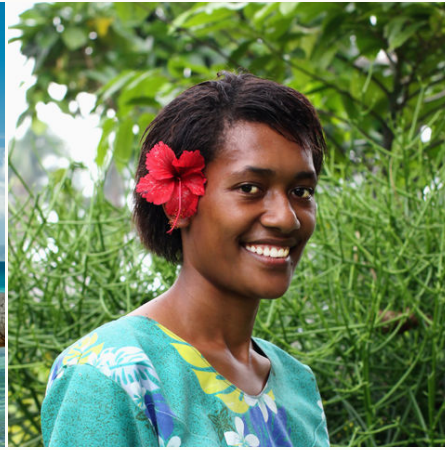
Viele Fijianerinnen tragen Blumen im Haar, Fiji