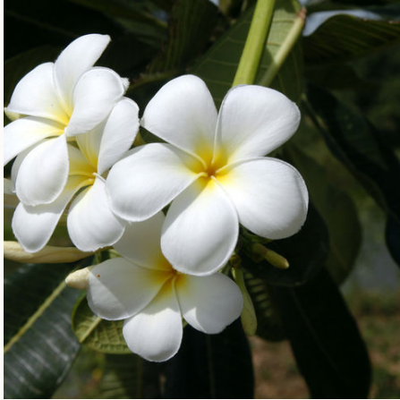
Weißer Blume, Fiji

Bei den oben genannten Preisen handelt es sich um die Ab-Preise.