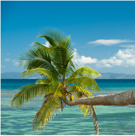
Palme reicht bis übers Wasser, Fiji