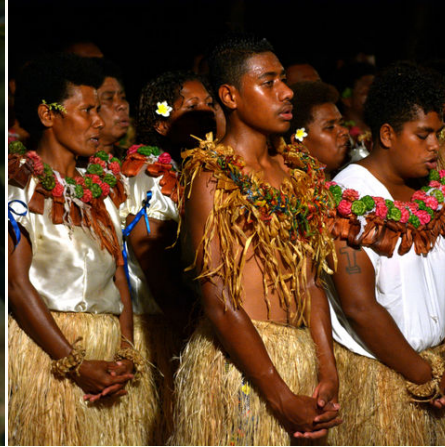
Einheimische tanzen und singen bei einem traditionellen Tanz, Fiji