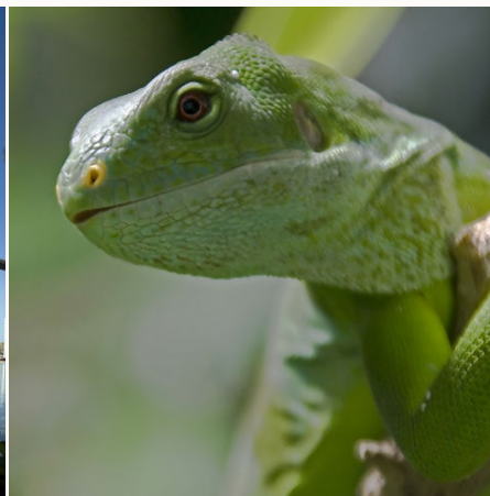
Giftgrüner Leguan, Fiji