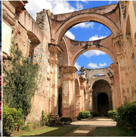
Kathedrale in Antigua, Guatemala