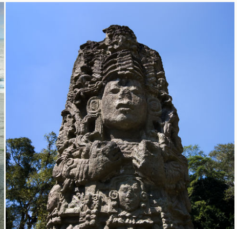
Zeugnis vergangener Zeiten, Honduras