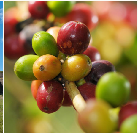
Jede Menge Arabica-Kaffeebohnen, Honduras