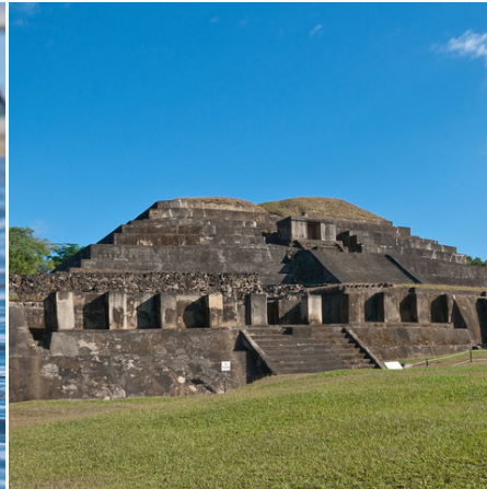
Mayastätte in Tazumal, El Salvador