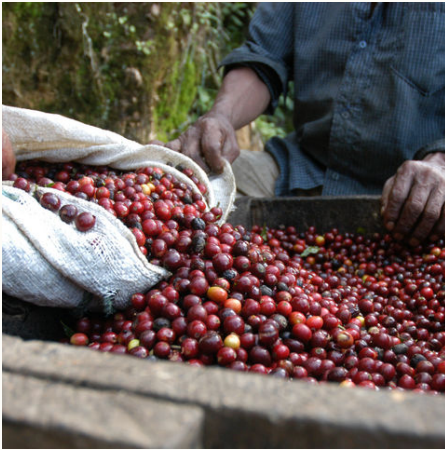
Einmal bei der Kaffeeernte zuschauen..., Guatemala