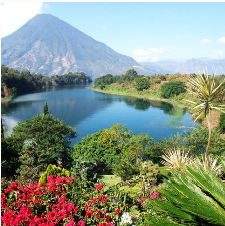
Hochland am Atitlán-See, Guatemala

Willkommen in Zentralamerika – der Heimat der berühmten Maya! Wir brechen auf in diese bunte Welt, eine abenteuerlichen Reise zwischen Karibikküste und Pazifik erwartet uns. In der durch Gegensätze faszinierenden Hauptstadt Guatemala startet unsere Reise durch drei Länder, die uns tolle Eindrücke in das traditionelle Leben der Einheimischen gewährt. Gelbe, rote, blaue, weiße und auch rosa Gebäude bezaubern uns in der charmanten Kolonialstadt Antigua. Die Stadt am Fuße dreier Vulkane hat ein besonderes Flair. So auch der wunderschöne Atitlán See und seine Umgebung, die wir auf einem Bootsausflug näher kennen lernen. Auf unserem Weg zu den archäologischen Höhepunkten der Maya Kultur besuchen wir traditionelle Dörfer, wunderschöne Märkte und lassen uns von der abwechslungsreichen Landschaft faszinieren. Die mystischen und vom Dschungel umschlossenen Ruinen der Jahrhunderte alten Tempelanlagen werden uns auch lange nach der Reise noch in Erinnerung bleiben. Weitere Highlights sind San Salvador und der Nationalpark Cerro Verde in El Salvador, sowie der Ort Copán in Honduras.