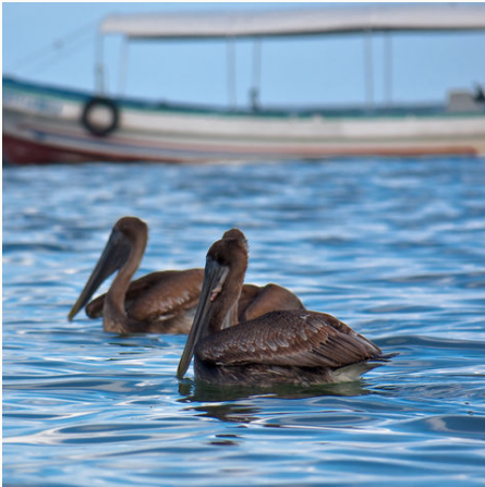
Pelikane in Livingston, Guatemala