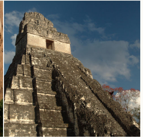
Maya-Tempel von Tikal, Guatemala