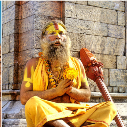
Saddhu im Tempel, Indien