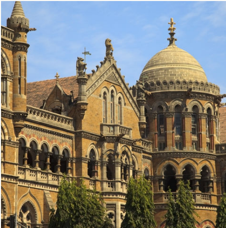
Victoria Terminus Bahnhof in Mumbai, Indien

Karnataka – Kaleidoskop der Kultur Indiens. In diesem Bundesstaat trifft die megamoderne quirlige Metropole auf jahrtausendealte UNESCO-Weltkulturerbe-Stätten. Schon immer Heimat verschiedenster Kulturen und Ort vielfältigster Religionen und Königreiche, nehmen Sie die zahlreichen Nationaldenkmäler mit in vergangene Zeiten. Lassen Sie Ihren Blick über das weite Grün der Western Ghats, mit seinen zahlreichen Nationalparks und der einzigartigen Pflanzen- und Tierwelt, streifen. Verlieren Sie sich in den magischen Tempelanlagen der Weltkulturerbe-Stätte Pattadakal, lassen Sie sich von den unwirklichen Felsformationen in Hampi beeindrucken und schlendern Sie durch die frühere Hauptstadt des mächtigen Vijayanagar-Königreiches. Dann können Sie Ihre gesammelten Eindrücke an den goldenen Stränden Goas entspannt Revue passieren lassen. Nicht umsonst sind Karnataka und Hampi in vielen Reisedepeschen die Top Ziele.