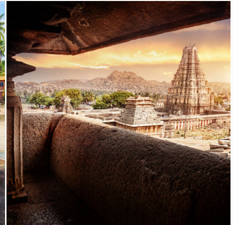
Virupaksha-Tempel in Hampi bei Sonnenaufgang, Indien