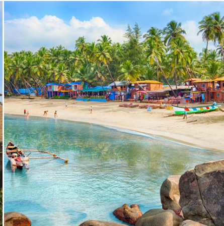
Palolem Beach, Indien