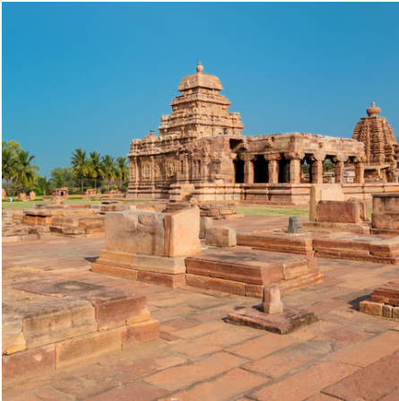
Tempel in Pattadakal, Indien