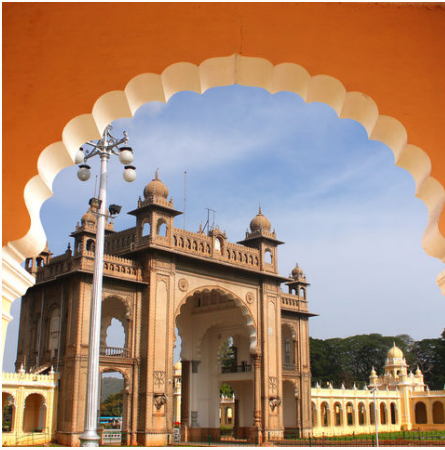
Palast in Mysore, Indien