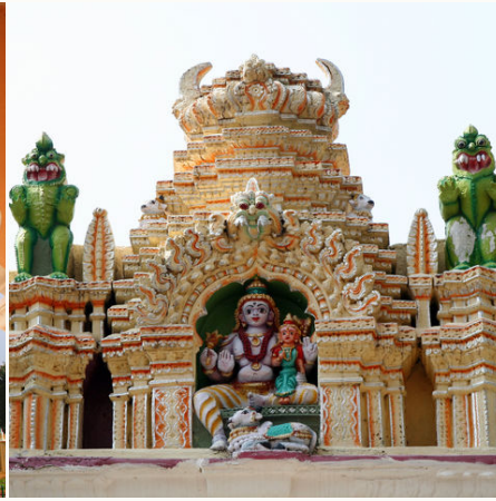
Bull-Tempel in Bangalore, Indien