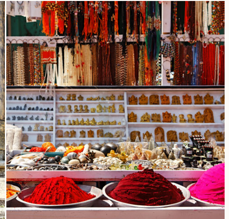
Markt in Hampi, Indien