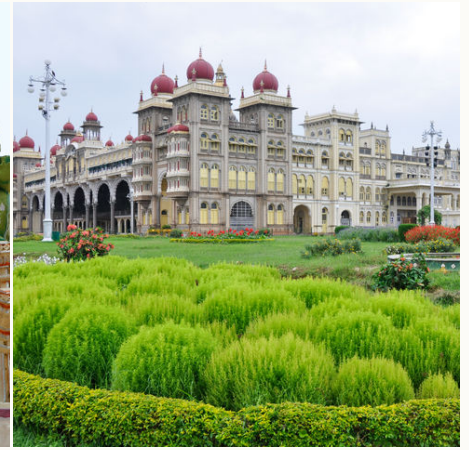
Palast in Mysore, Indien