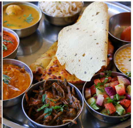
Typisch indische Mahlzeit, Indien