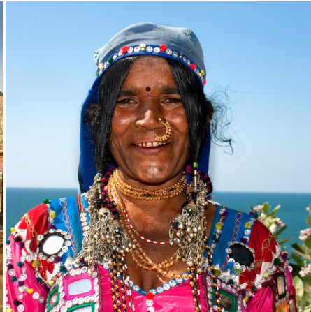
Eine Frau mit traditionellem Kleidungsstil, Indien