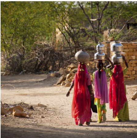
Ländliches Leben, Indien

Leben wie ein Maharadscha in Rajasthan? Prunkvolle Festungen, alte Handelsstädte, Safaris im Nationalpark & logieren in einst mächtigen Wohnsitzen der Fürsten gepaart mit dem Besuch sozialer Projekte und einem aktuellen Bollywood-Streifen macht diese Indien-Rundreise zu einem Erlebnis des alten und neuen Indiens.