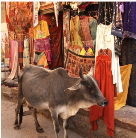
Kuh auf bunter Jaisalmer Straße, Indien