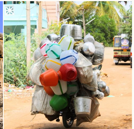
Fahrender Topf-Verkäufer, Indien