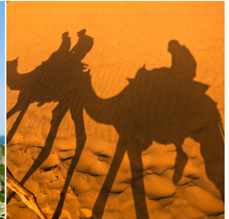
Kamelritt in der Thar-Wüste bei Jaisalmer, Indien