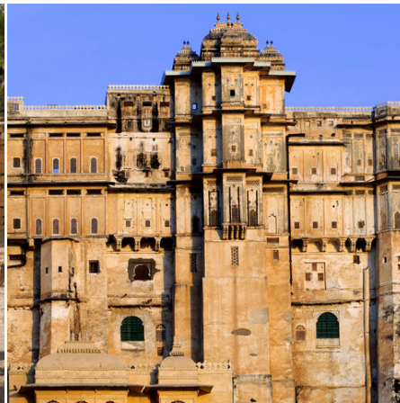
Stadtpalast am See in Udaipur, Indien