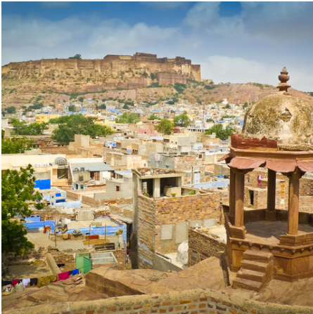
Panorama von Jodhpur, Indien