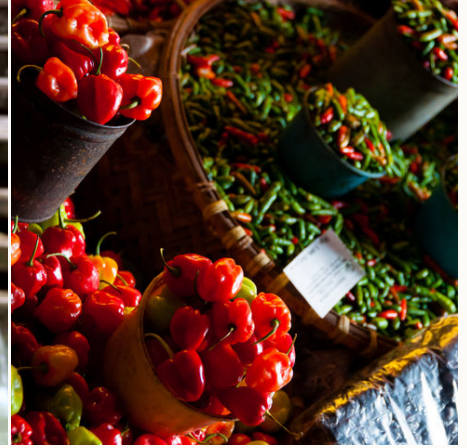
Rote Chilis auf dem Markt, Indonesien