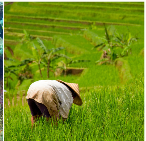
Arbeiter auf dem Reisfeld, Indonesien