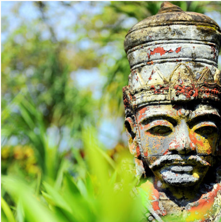
Hinduistische Statue, Indonesien