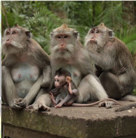
Affenfamilie auf Bali, Indonesien