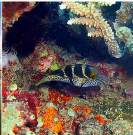
Unterwasserwelt Balis, Indonesien