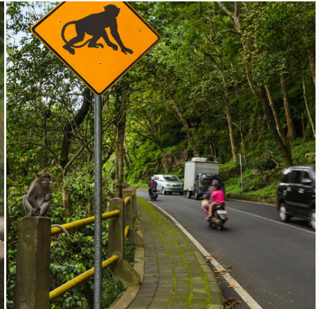
Verkehrsschild auf Bali, Indonesien