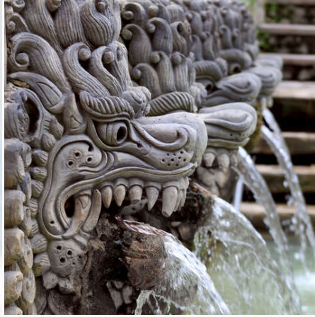
Verzierter Wasserspeier, Indonesien