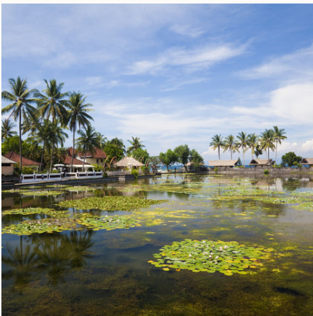
Umgebung von Candidasa, Indonesien

„Insel der Götter“ wird sie liebevoll von ihrer Bevölkerung genannt. Traditionen, Bräuche und eine unendlich vielfältige Kultur lockt die einen, die atemraubende Naturschönheit die anderen und die romantische Atmosphäre der Inselstrände noch wieder andere. Bali hat unglaublich viel zu bieten! Gehen Sie so manch einer Geschichte oder Sage auf den Grund, ernten Sie gemeinsam mit den Farmern die für uns so fremden Früchte und genießen Sie die Wärme der ersten Sonnenstrahlen hoch oben auf dem Mt. Batur. Langsam plätschert das heilende Wasser aus den Drachen-Fontänen vor Ihnen und Sie lauschen den Melodien des Dschungels um sich herum. Erleben Sie die Insel im Uhrzeigersinn und im Takt Balis, bevor Sie es sich am Strand von Sanur mit einem exotischen Früchtemix unter sich wiegenden Palmen gut gehen lassen können. Bali ist ein Paradies für Entdeckerherzen und Erholungssuchende gleichermaßen – einfach ein wunderschönes Fleckchen Erde!