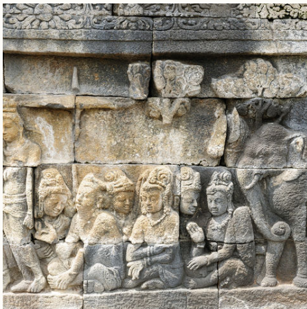
Reliefs im Borobudur-Tempel, Indonesien

Sattgrüne Reisterrassen, traumhafte Strände, außergewöhnliche Tempel, vulkanische Gebiete und idyllische Örtchen locken zu Fuß und per Rad. Sie reisen zu den zwei bekanntesten Inseln Indonesiens – Java und Bali. In Yogyakarta vermengen sich Kultur und Moderne. Hingegen bestechen die UNESCO Weltkulturerbestätten Borobudur und Prambanan durch ihre imposante Bauweise und ziehen jeden Besucher in ihren Bann. Erleben Sie die surreale Mondlandschaft am Mount Bromo, besuchen Sie den türkisfarbenen Kratersee des Ijen-Vulkans und genießen Sie das magische Flair des Künstlerortes Ubud. Auch am Ende wartet noch ein Highlight auf Sie: Gili Air bietet sich hervorragend an für Schnorchelgänge oder um einfach am feinen Sandstrand die Seele baumeln zu lassen. Indonesien fesselt und lädt Sie mit seiner Vielfältigkeit und dem Naturreichtum zum Entdecken ein.