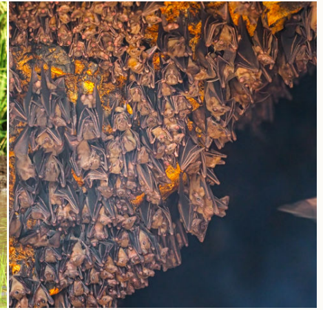
Im Fledermaustempel Goa Lawah, Indonesien