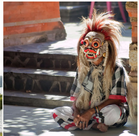
Traditionelle Rangda Maske, Indonesien