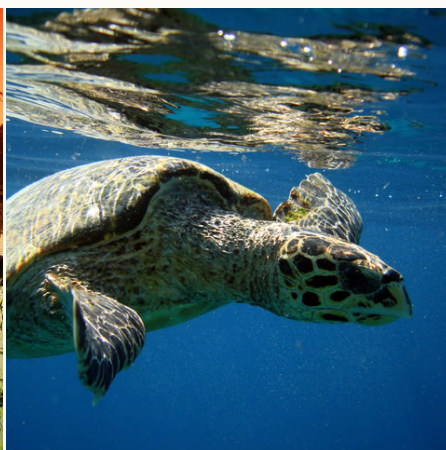
Schildkröte in den Gewässern um Lombok, Indonesien