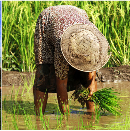
Arbeiterin im Reisfeld, Indonesien