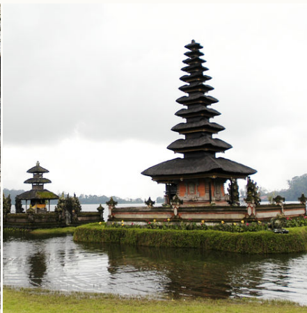
Ulun Danu-Tempel, Indonesien