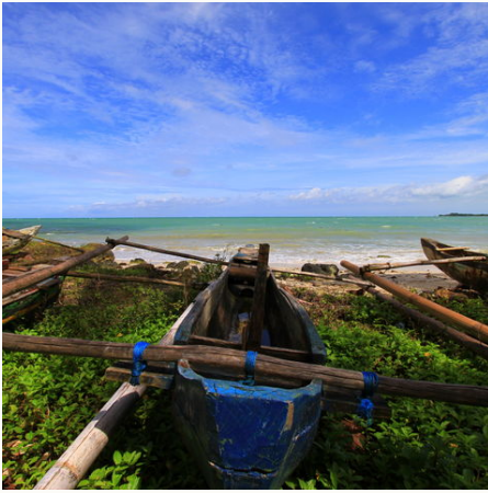
Blaues Boot am Strand, Indonesien