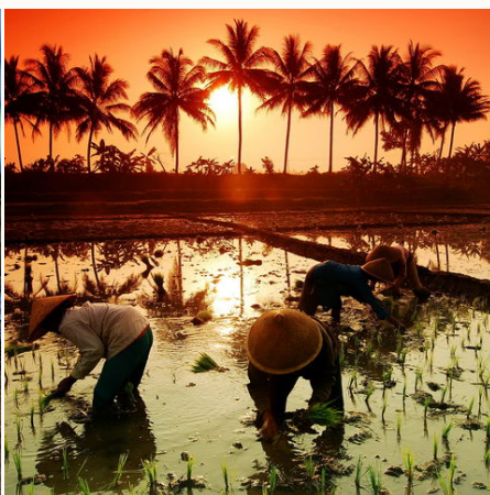
Sonnenuntergang über einem Reisfeld, Indonesien