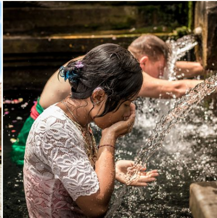
Hinduistische Zeremonie im Pura Tirta Empul-Tempel, Indonesien