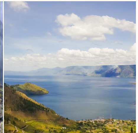
Der See-Toba im Norden von Sumatra, Indonesien