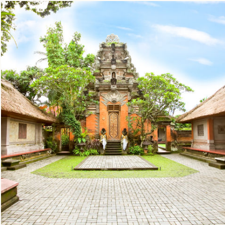
Der Royal Palace in Ubud, Indonesien