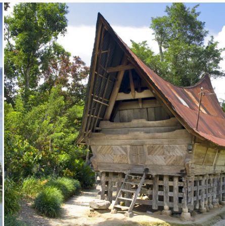
Traditionelles Batak Haus auf der Insel Samosir, Indonesien