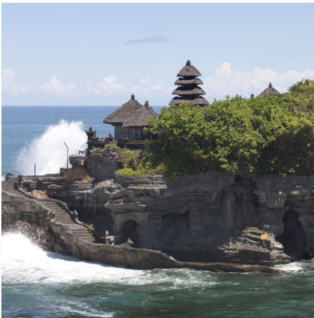
Der Tanah Lot Tempel vor der Westküste Balis, Indonesien