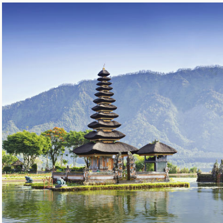
Ulan Danu Tempel auf Bali, Indonesien