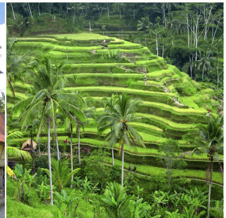
Grüne Reisterassen, Indonesien