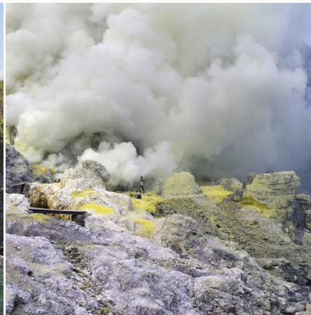
Schwefelsee am Ijen-Vulkan au Java, Indonesien