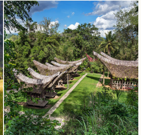
Traditionelles Toraja-Dorf, Indonesien