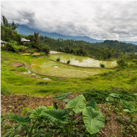
Reisterassen in Tana Toraja, Indonesien