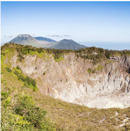
Mahawu-Vulkan auf Sulawesi, Indonesien

Unberührt, sagenumwoben, exotisch! Sulawesi bietet als eine der 17.000 Inseln Indonesiens eine unbeschreiblich große Tierwelt, traumhafte unberührte Landstriche und eine interessante Kultur. Ein Einblick in den Alltag der Toraja: Gräber in den Klippen mit bewachenden Tau Taus davor oder ihre mit Bambus gedeckten verzierten Häuser. Traditionen und ein Lebensalltag zum Staunen! Auf einer 2-tägigen Wanderung erleben Sie die Faszination Karstlandschaft. Sie erkunden die imposanten, mit Höhlen bespickten Kalksteinformationen und sattgrünen Reisfelder. Sie übernachten bei einer lokalen Familie und entdecken während eines Kochkurses die exotische Welt sulawesischer Köstlichkeiten. Vom Süden geht es in den Norden! Tauchparadiese, heiße Quellen nahe den Vulkanen und wunderschöne Wälder voller seltener Tierarten finden sich im nördlichen Sulawesi. Vielleicht haben Sie Glück und erspähen einen der bunten Nashornvögel oder einen Koboldmaki (Gespensteraffen) hoch oben in den Bäumen umrahmt von wildwucherndem Grün – welch ein Naturparadies!