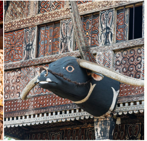
Büffel Holzschnitzerei eines Tongkonan Hauses, Indonesien