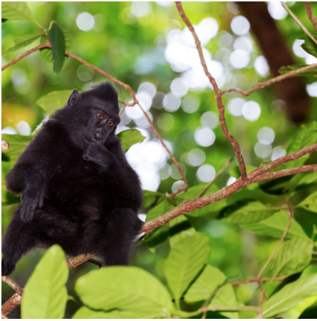
Schopffaffe sitzt auf einem Baum, Indonesien