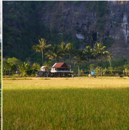
Dorf in der Karstlandschaft, Indonesien