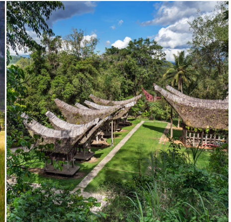
Traditionelles Toraja-Dorf, Indonesien