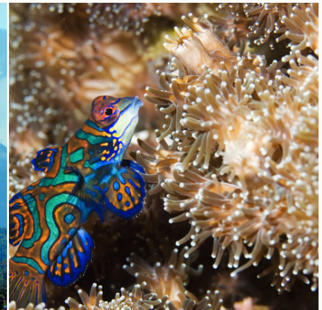
Mandarinfisch am Korallenriff vor Sulawesi, Indonesien