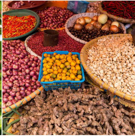
Gemüse auf einem Markt in Tomohon, Indonesien