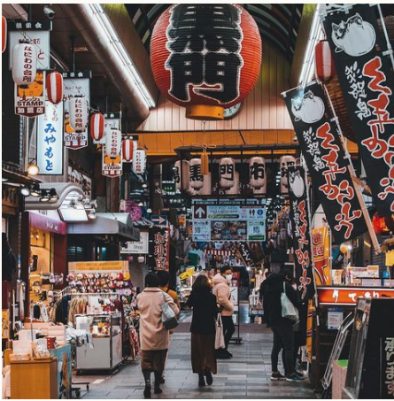
Markt in Osaka, Japan

Bei dieser Sternreise übernachten Sie in der Kulturmetropole Kyoto mit seinen tausenden Tempeln. Die Gegend um Osaka und Kyoto lässt sich wunderbar auf Tagesausflügen erkunden: Ohne Kofferpacken und mit leichtem Gepäck verbringen Sie den Tag und kehren abends in Ihr Hotel zurück. Auf Wunsch können Sie auch in Osaka anstatt in Kyoto übernachten.