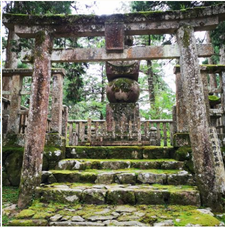
Friedhof in Koya-san