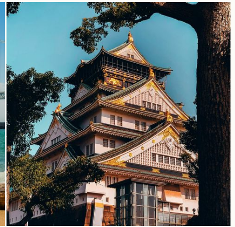
Burg in Osaka, Japan