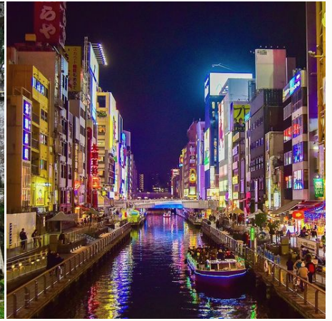
Osaka by night, Japan