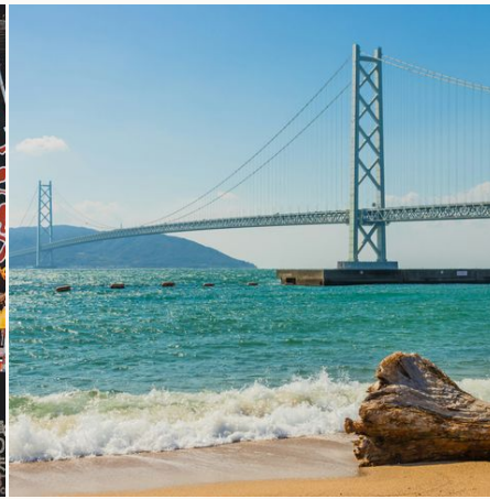
Strand in Kobe@thomas schmitz auf unsplash,