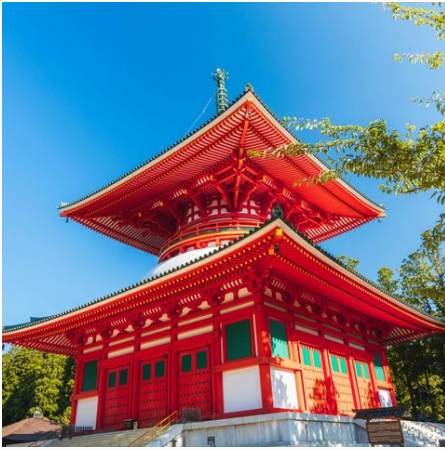
Tempel Besuch auf dem heiligen Koya-san