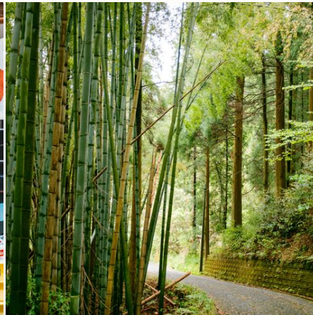
Schlendern im Bambuswald, Japan