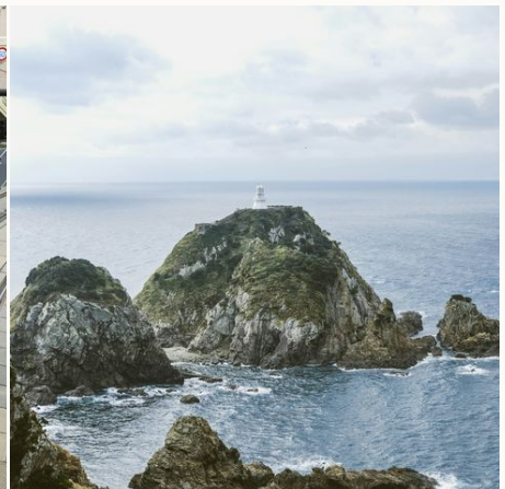
Küstenlinie bei Kagoshima, Japan