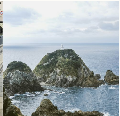
Küstenlinie bei Kagoshima, Japan