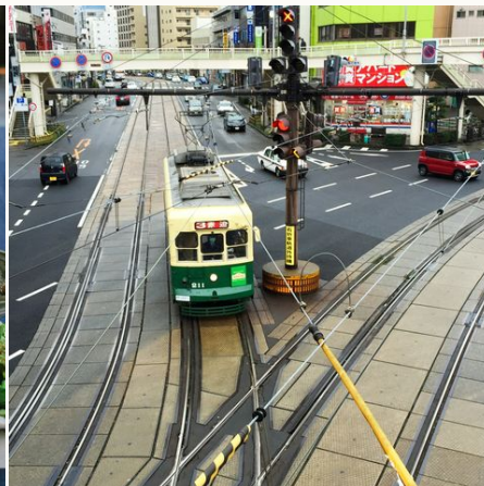
Strassenszene in Nagasaki, Japan