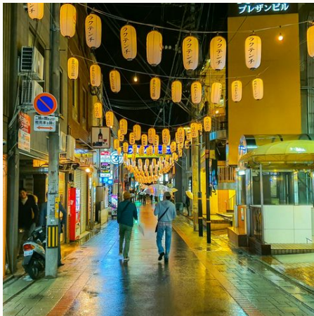
In den Strassen Beppus bei Nacht @ hyun-kim-auf-unsplash, Japan