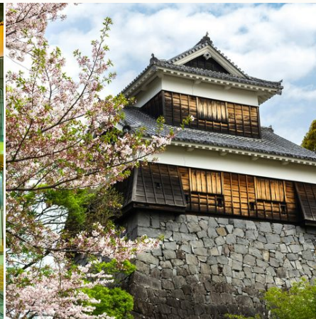
Uralte Kumamoto-Burg, Japan