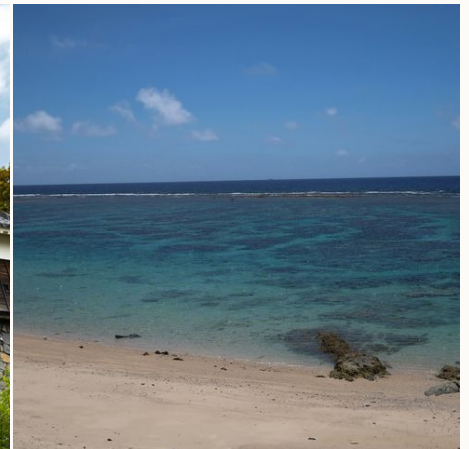
Ein herrliches Bad im Meer in Kagoshima @ megumi-kusano-auf-unsplash, Japan