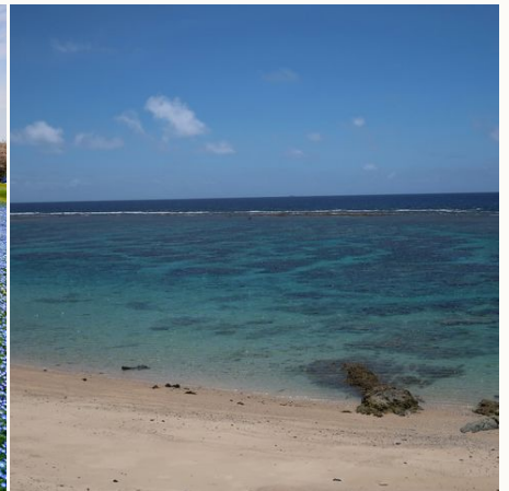
Ein herrliches Bad im Meer in Kagoshima @ megumi-kusano-auf-unsplash, Japan