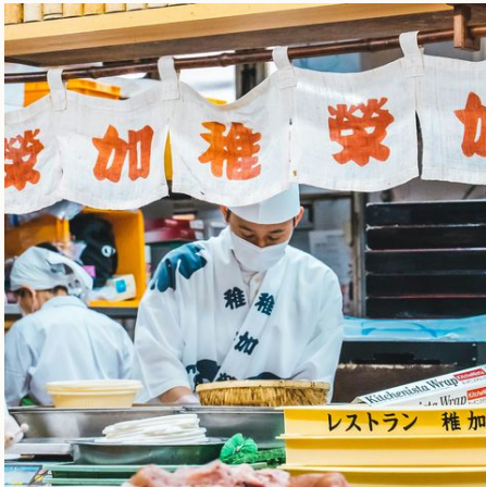
Leckere Köstlichkeiten...@romeo auf unsplash, Japan