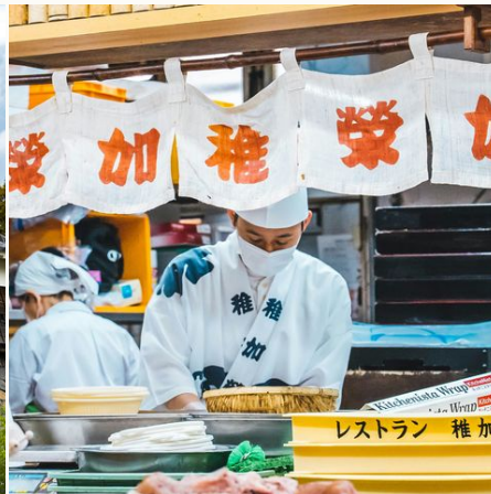
Leckere Köstlichkeiten...@romeo auf unsplash, Japan