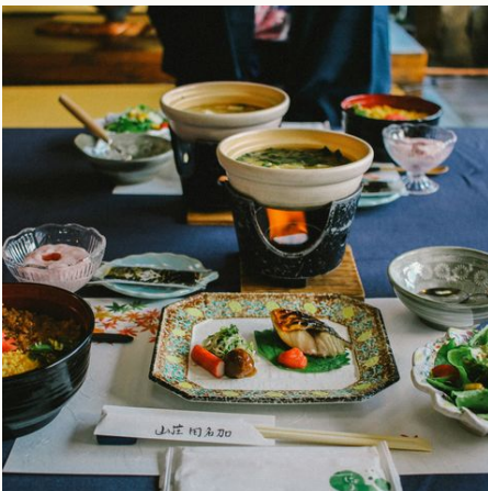
Herrliches Kaiseki Dinner in Fukuoka, Japan

Entdecken Sie die faszinierende Südinself Kyushu auf einer individuellen Mietwagenreise, die Ihnen die große Vielfalt dieser Region näherbringt. Sie beginnen Ihre Kyushu-Reise in der pulsierenden Stadt Fukuoka, wo lebhaft Märkte, historische Sehenswürdigkeiten und die kulinarischen Genüsse der Yatai-Stände auf Sie warten. Lassen Sie sich von den beeindruckenden Landschaften und kulturellen Schätzen entlang Ihrer Route verzaubern, während Sie mit dem Mietwagen flexibel durch die malerischen Städte und atemberaubenden Naturgebiete fahren. In Nagasaki bewegt Sie die Geschichte, bevor Sie in den heißen Thermalbädern von Kurokawa Onsen eintauchen. Die Vulkanlandschaften von Kumamoto und die lebendige Atmosphäre von Kagoshima bieten Ihnen ein spannendes Kontrastprogramm, während Sie auf Yakushima in eine märchenhafte Welt aus uralten Wäldern und glitzernden Küstengewässern eintauchen. Miyazaki begeistert mit seiner charmanten Katzeninsel Aoshima und köstlicher regionaler Küche, und in Beppu erleben Sie die spektakulären „Sieben Höllen“ und traditionelle Bambuskunst. Ihre Mietwagenreise durch Kyushu vereint Abenteuer, Entspannung und kulturelle Höhepunkte und lässt Sie mit unvergesslichen Eindrücken von Japans faszinierender Südinself zurück.