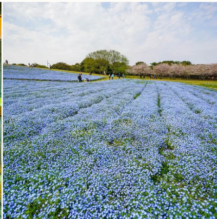
Fukuoka Uminonakamichi Seaside Park, Japan