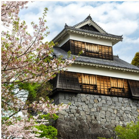
Uralte Kumamoto-Burg, Japan