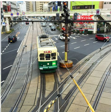
Strassenszene in Nagasaki @ yuika- takamura-auf-unsplash, Japan