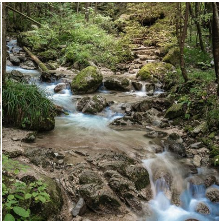
Plätschernder Wildbach bei Nagiso, Japan