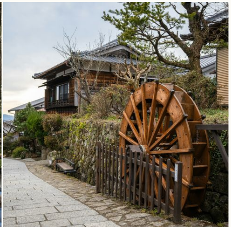
Spazieren durch Dörfer im Kiso-Tal, Japan