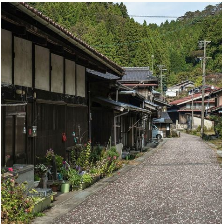
Dorfansicht im Kiso-Tal, Japan

Die 10-tägige selbstgeführte Wandertour durch Nakasendo und Kamikochi ist perfekt für Wander- und Spaziergang-Begeisterte. Die Tour beginnt mit einer 5-tägigen Wanderung auf dem klassischen Nakasendo-Pfad. In Kamikochi genießen Sie eine Wanderung im Hochlandtal des Chubu Sangaku Nationalpark: Die natürliche Schönheit der Gegend ist atemberaubend. Im Bergort Komoro oder Karuizawa genießen Sie eine komfortable Nacht in einem Onsen-Ryokan, einem traditionellen Gasthaus mit heißen Quellen. Ein feines Frühstück und eine herrliche Wanderung in abgelegener Gegend erwarten Sie, bevor Sie Ihre Reise in das Nikko-Gebiet fortsetzen. Sie wandern sowohl im Nikko-Yumoto-Gebiet als auch in der Oku-Nikko-Ebene, bevor Sie weiter nach Tokio reisen. Gerne bieten wir Ihnen auch kürzere Wander-Touren an!