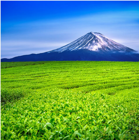
Leuchtend grüne Teefelder vor dem Mount Fuji, Japan