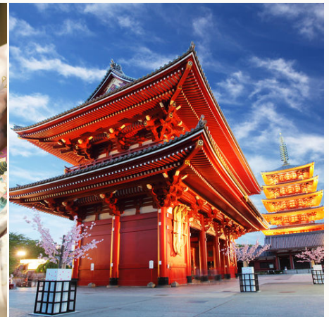
Gehört zu den schönsten Tokios: der Asakusa Tempel bei Dämmerung, Japan