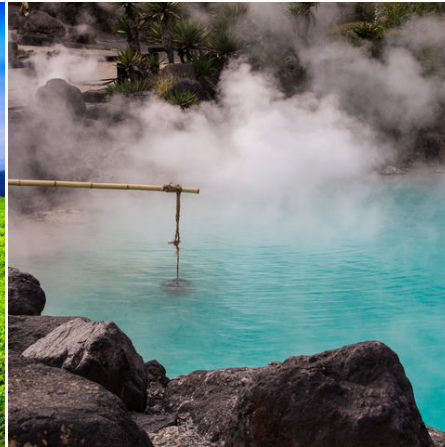
Heißer Onsen, Japan