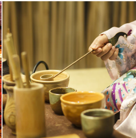
Traditionelle Teezeremonie, Japan