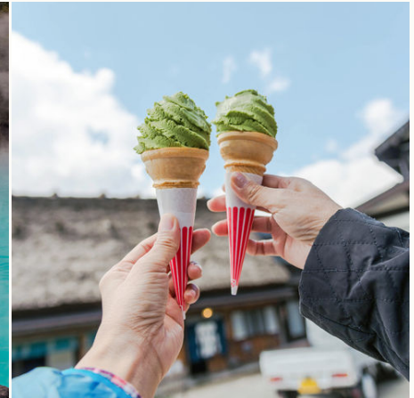
Eiscreme à la Grüntee, Japan