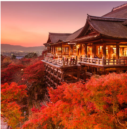
Soll helfen Liebesglück zu finden: der Kiyomizu-dera Tempel in Kyoto, Japan

Kommen Sie mit uns nach Japan, dem Land der aufgehenden Sonne, aber auch Land der Kontraste. Erleben Sie atemberaubende Landschaften auf Miyajima und im Fuji Hakone Nationalpark. Lassen Sie sich treiben in mit Neonlicht durchfluteten Gigametropolen und schwelgen Sie in der heiligen Atmosphäre uralter Tempel und Schreine. Entlang der Goldenen Route von Kyoto nach Tokio, besuchen Sie neben Zen-Gärten und quirligen Marktgassen auch die UNESCO-Welterbestätten der historischen Altstadt von Takayama und Kamakura, den Burgkomplex von Himeji, sowie die einmaligen Highlights von Hiroshima und Nara. Willkommen in Japan. Yokoso!