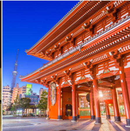
Roter Senso-ji Tempel und Skytree Tower, Tokio, Japan