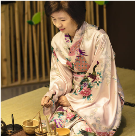
Eine Teemeisterin während einer traditionellen Teezeremonie, Japan