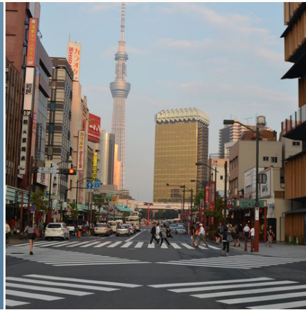
Kreuzung in Tokio, Japan