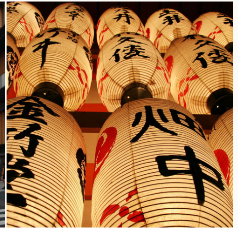
Japanische Laternen bei Nacht, Japan