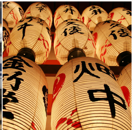
Japanische Laternen bei Nacht, Japan