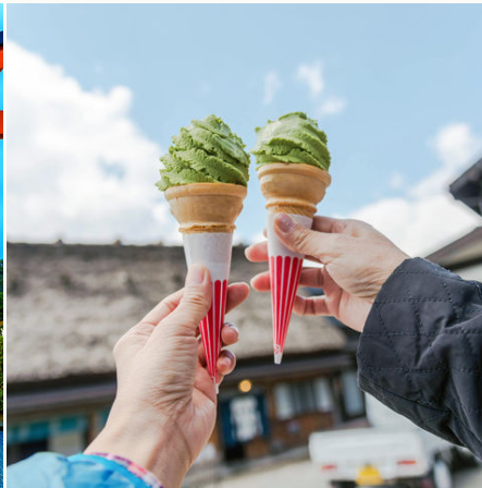
Eiscreme à la Grüntee, Japan