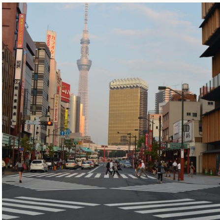
Kreuzung in Tokio, Japan