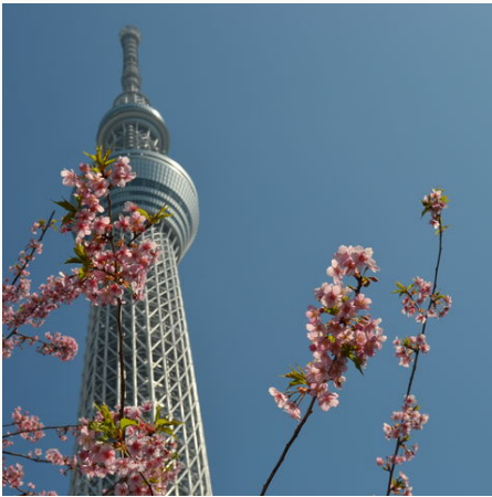
Kirschblüte (Sakura) vor dem Sky Tree in Tokio, Japan

✓ Verfügbar ⚠ Wenige Plätze - Ausgebucht ✓ garantierte Durchführung