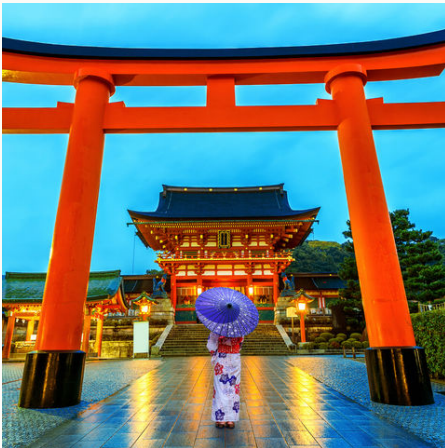
Japanerin im Fushimi Inari Taisha Schrein in Kyoto, Japan