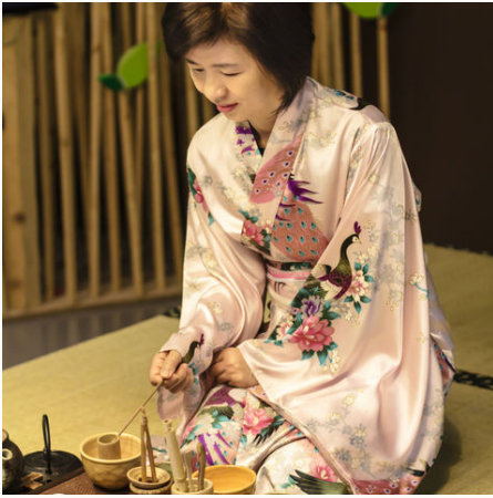
Eine Teemeisterin während einer traditionellen Teezeremonie, Japan