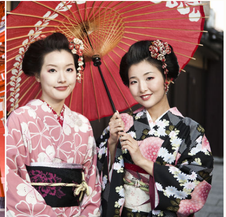
Japanische Frauen im Kimono, Japan