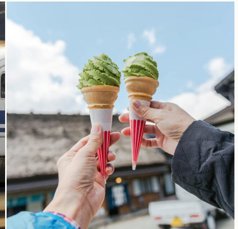
Eiscreme à la Grüntee, Japan