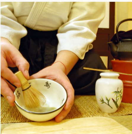
Traditionelle Teezeremonie, Japan

Diese Reise führt Sie in die atemberaubende Natur von Kyushu und Okinawa. In Kumamoto, dem sogenannten „Land des Feuers“, bietet sich Ihnen ein eindrucksvoller Blick auf die Bergregion Aso, die sich besonders zum Wandern eignet. In Kagoshima bestaunen Sie den aktiven Vulkan Sakurajima. Zum Abschluss können Sie auf Okinawa und auf der tropischen Insel Ishigaki einfach die Seele baumeln lassen. Zwischen April und Oktober ist die beste Reisezeit, um die Reise mit einem Badeaufenthalt ausklingen zu lassen.