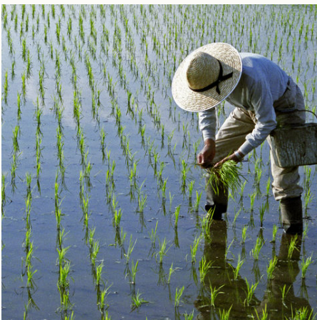
Japanischer Bauer beim Reisanbau, Japan