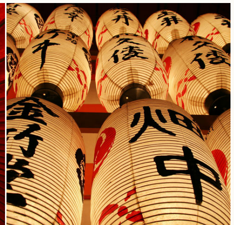
Japanische Laternen bei Nacht, Japan