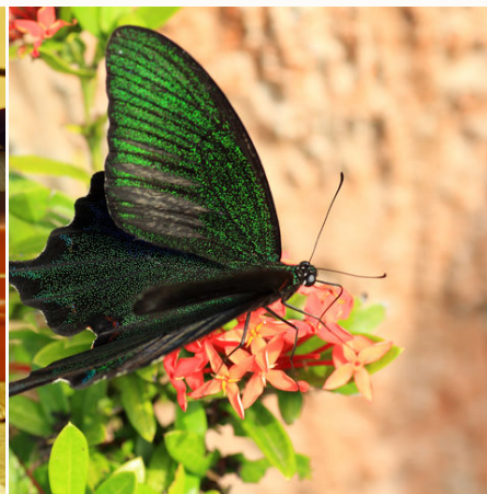
Schmetterling Ryukyu Peacock, Japan