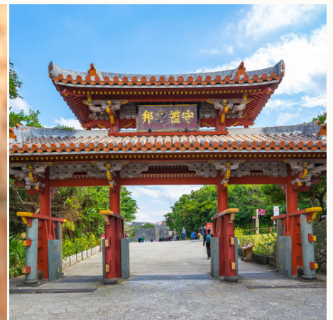
Burg Shuri in Okinawa, Japan