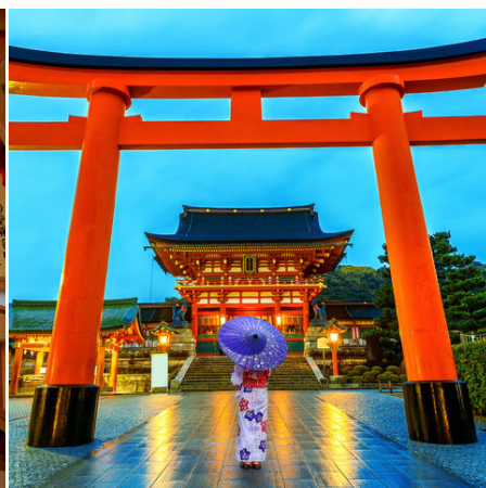
Japanerin im Fushimi Inari Taisha Schrein in Kyoto, Japan