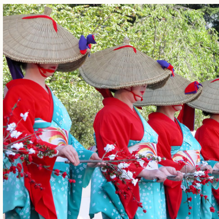
Frauen bei einem japanischen Matsuri (Volksfest) in Miyagi, Japan