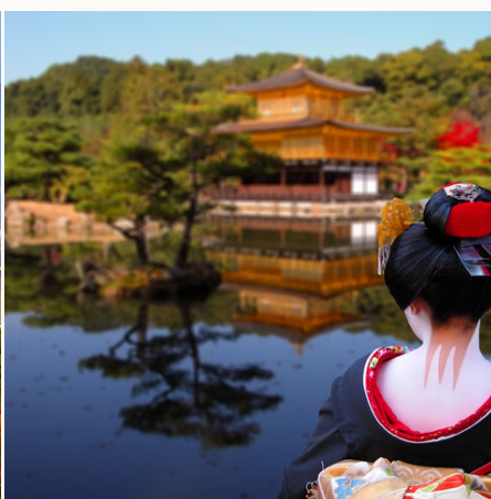
Geisha blickt auf den Goldenen Tempel, Japan