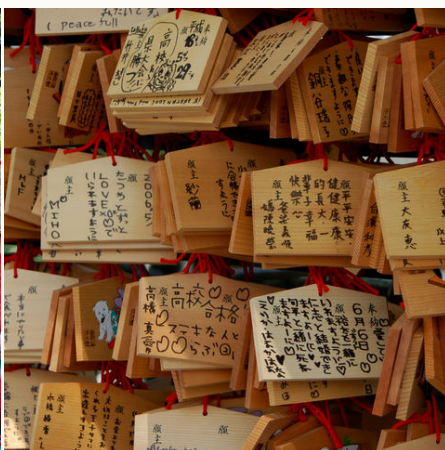
Holztäfelchen mit Gebeten in einem Tempel in Kyoto, Japan