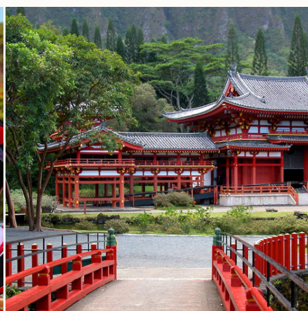
Der Tempel Byodo-in in Uji, Kyoto, Japan