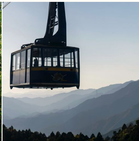
Seilbahnfahrt am Tempel 21 Tairyu@jihendrik-morkel-auf-unsplash, Japan