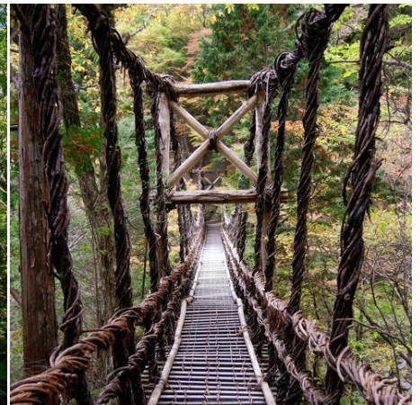
Kazurabashi-Hängebrücke, Japan