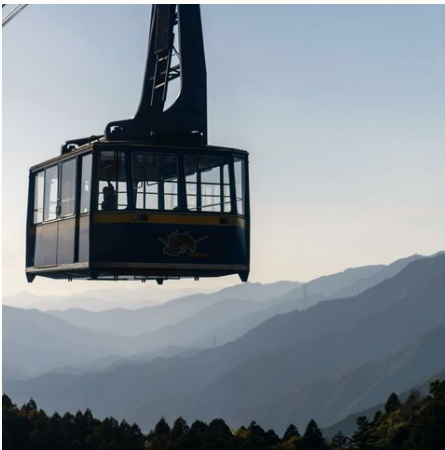
Seilbahnfahrt am Tempel z1 Tairyu, Japan

Shikoku ist die viertgrößte Insel Japans und beherbergt einige spektakuläre und unerschlossene Landschaften des Landes. Die Insel beherbergt auch einen uralten Wanderweg, den anspruchsvollen Shikoku-88-Tempel-Pilgerweg. Der Weg verbindet 88 buddhistische Tempel miteinander, und die gesamte Strecke umfasst mehr als 1.000 Kilometer. Pilger, die als Ohenro bekannt sind, legten die Strecke traditionell über viele Wochen zu Fuß zurück und übernachteten in Shukubo-Tempelunterkünften. Die meisten modernen Reisenden reisen heute mit dem Reisebus von Tempel zu Tempel, aber wir haben Abschnitte der ursprünglichen Route gefunden, die man noch immer zu Fuß zurücklegen kann. Entdecken Sie das Land auf dieser 10-tägigen selbstgeführten Wanderreise in Ihrem eigenen Tempo mit unseren detaillierten Karten und Wanderanweisungen. Alles andere, von den Bahntickets bis zu den Unterkünften wird von uns organisiert, so dass Sie sich ganz auf die Entspannung und den Genuss der ausgezeichneten hausgemachten Mahlzeiten und der erstklassigen Gastfreundschaft vor Ort konzentrieren können. Gerne bieten wir Ihnen auch kurze Wander-Touren an!